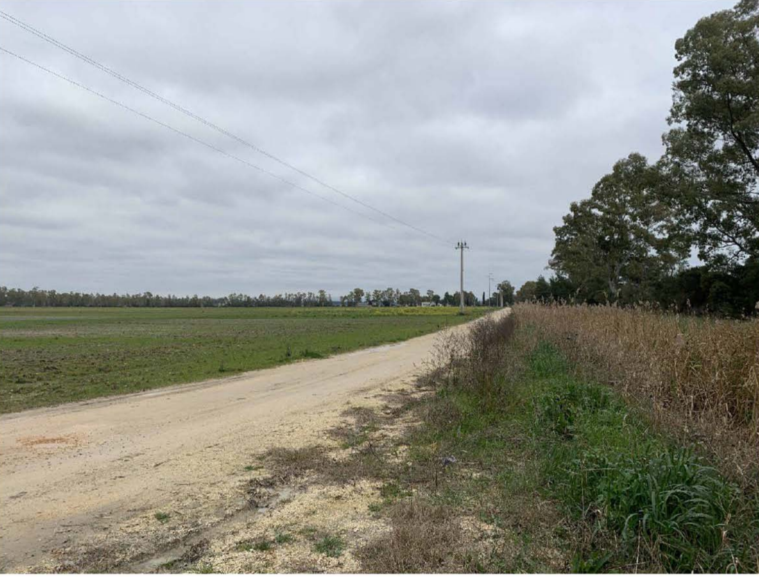
VISTA AREA DI IMPIANTO DA AUTOSTRADA E55