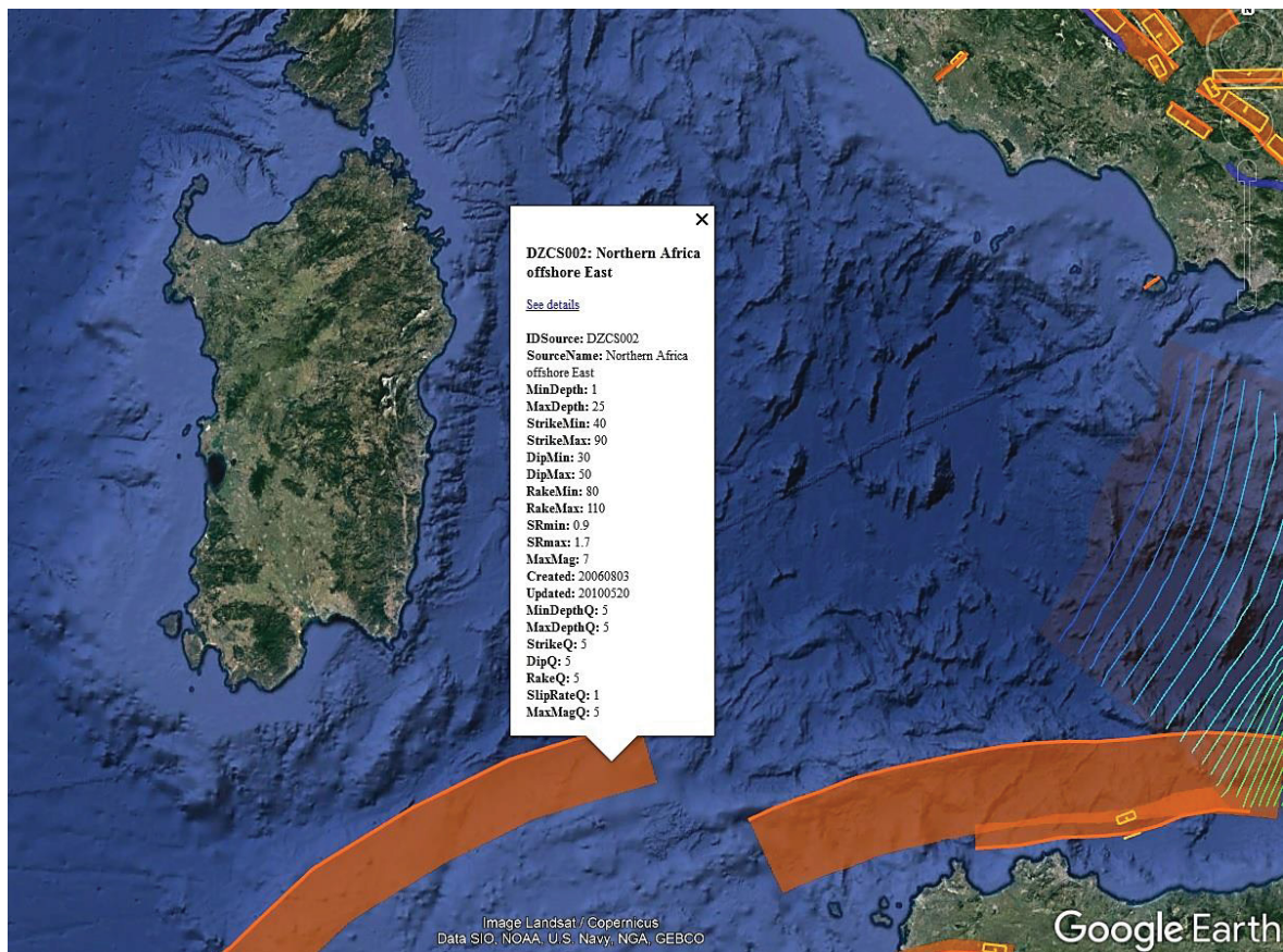
Figura 2 - INGV - DISS3 - Mappa dei lineamenti sismogenetici su Google Earth (dettaglio)

Da quanto sopra riportato è ragionevolmente possibile classificare il sito in esame come avente sismicità molto bassa .