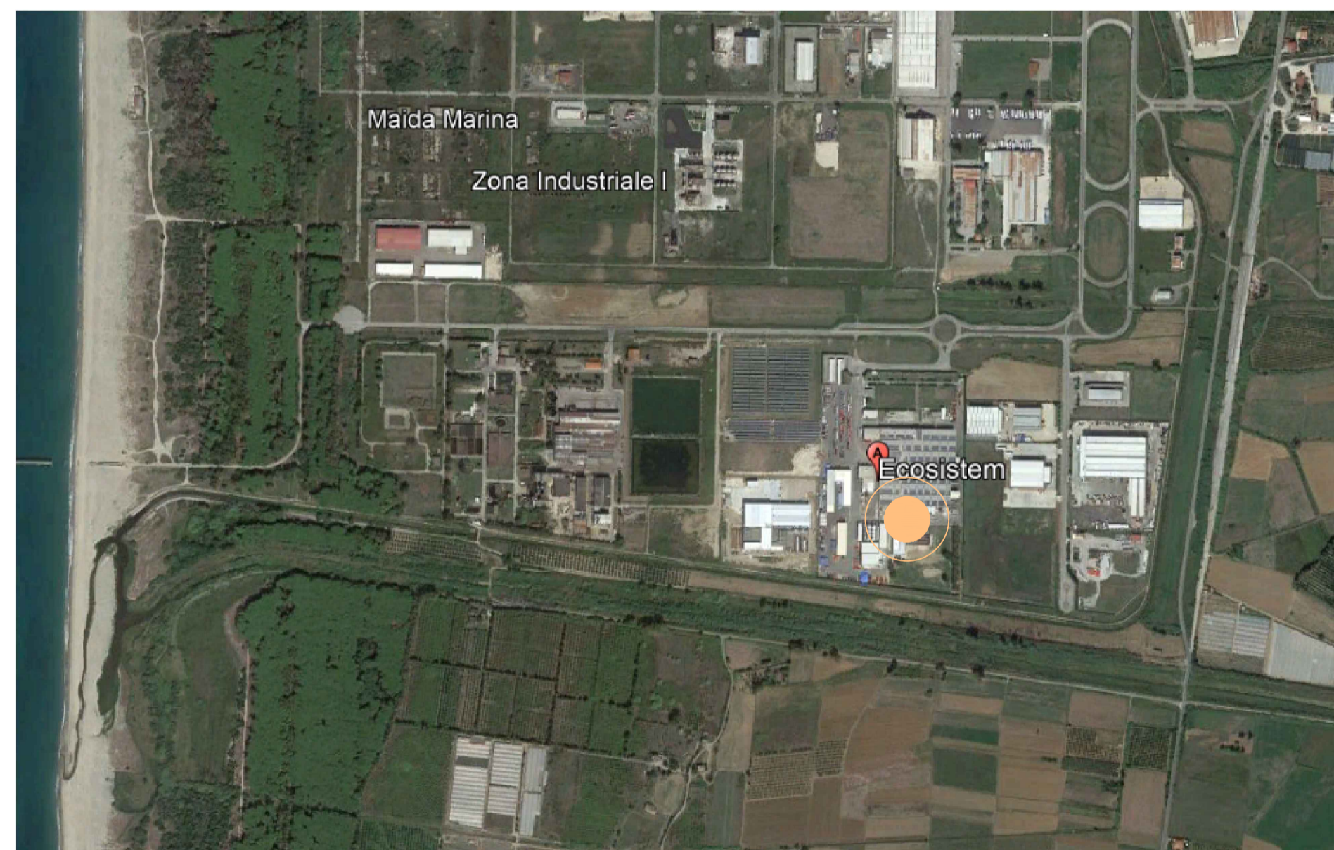
ECOSISTEM - LOC. LAMEZIA TERME (CS)