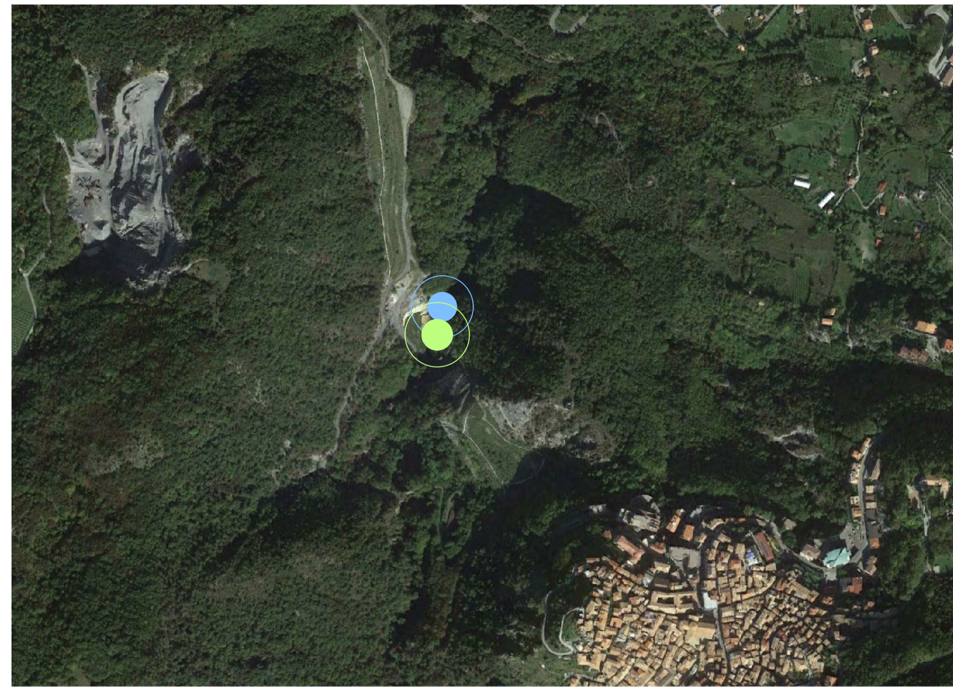
CAVA SOLA - LOC. MORMANNO (CS)