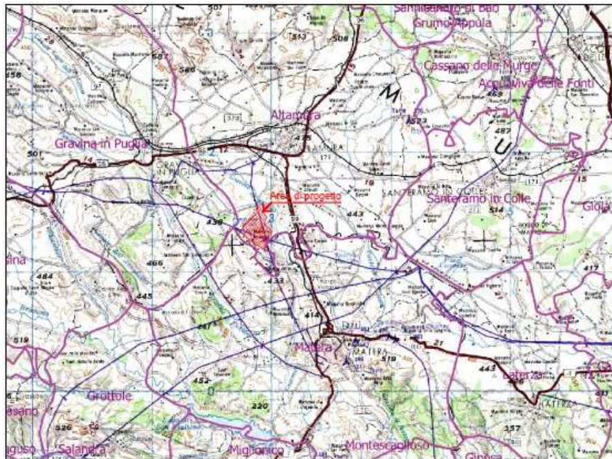
Figura 1- Inquadramento geografico