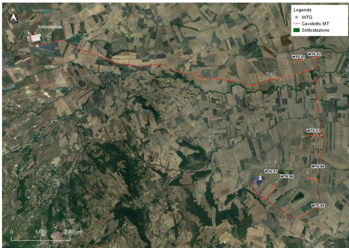
Figura 1 - Inquadramento su Ortofoto

Il parco eolico in oggetto si sviluppa all'interno dei territori comunali di Bovino e Troia, in località "Serrone".