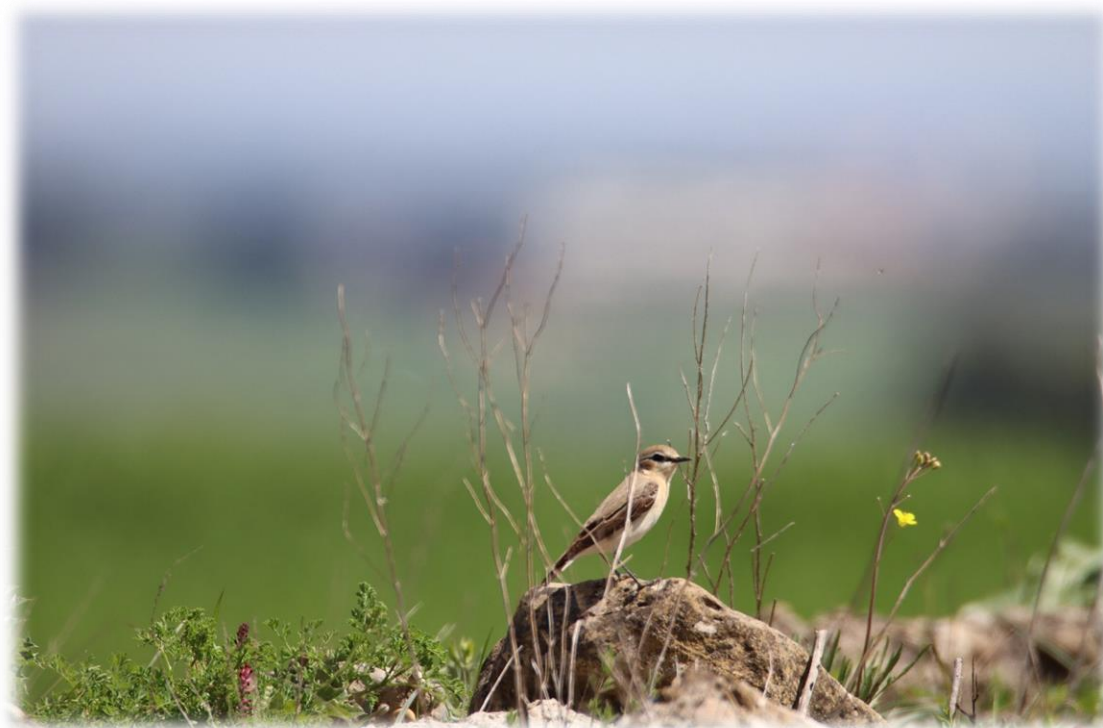
Culbianco ( Oenanthe oenanthe )