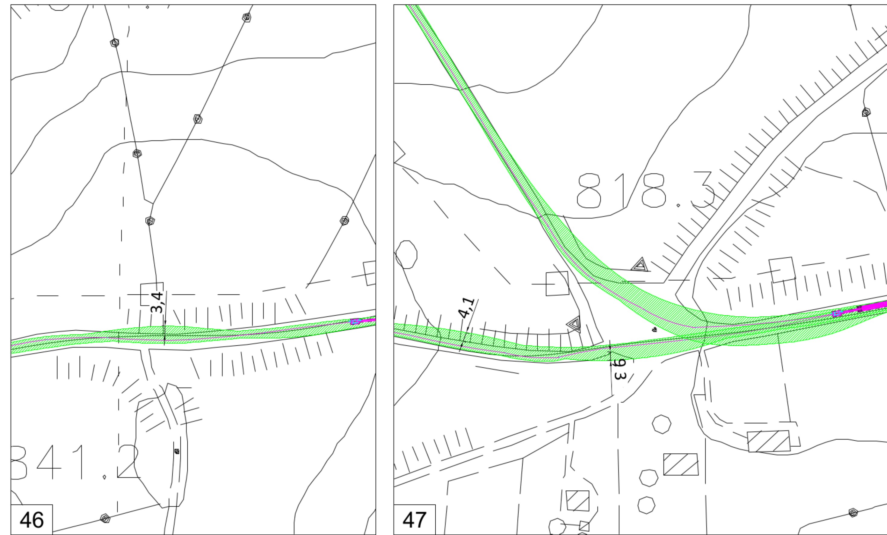
PERCORSO CALTAVUTURO 2 - INGRANDIMENTI scala 1: 100