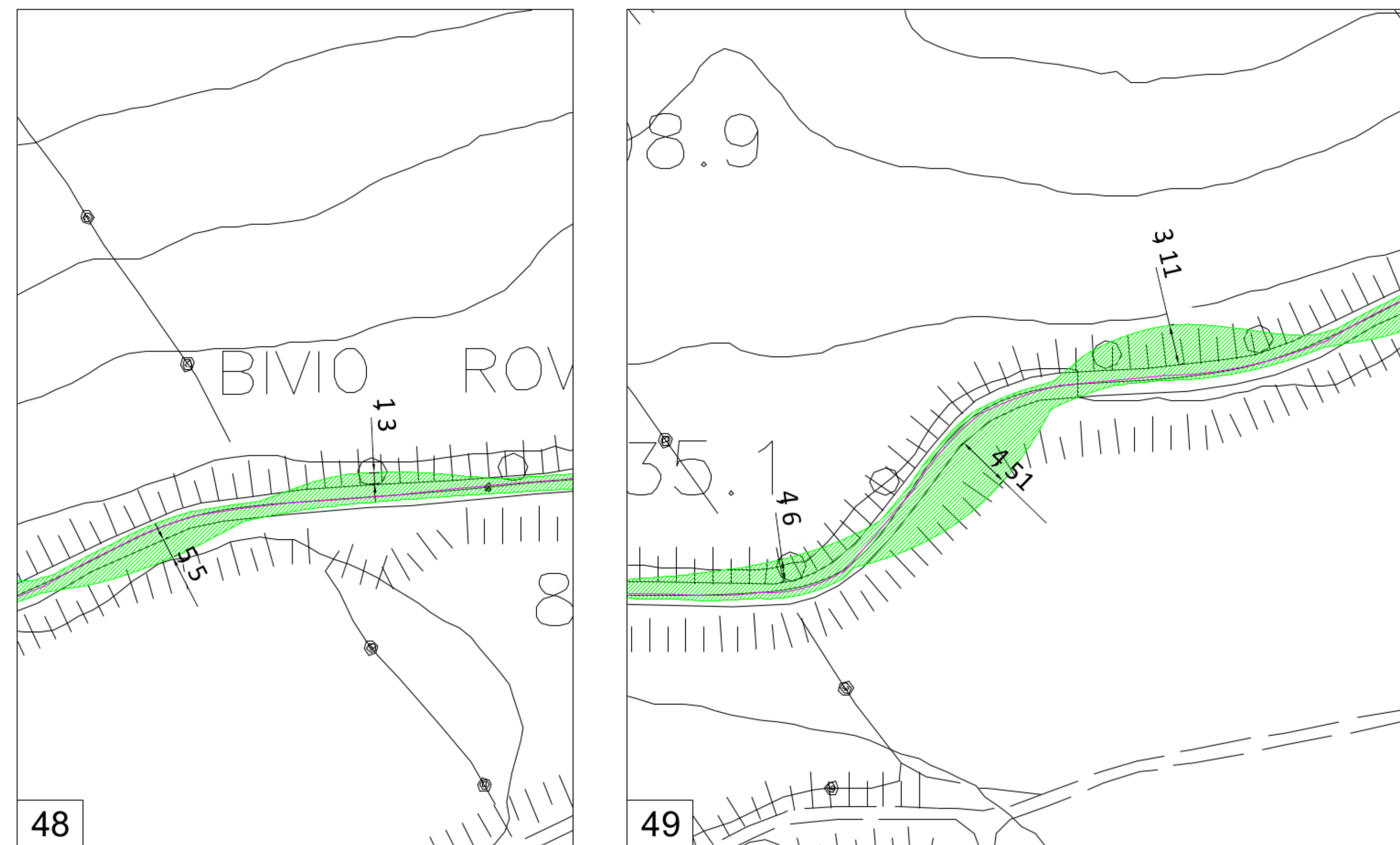
PERCORSO CALTAVUTURO 2 - INGRANDIMENTI scala 1: 100