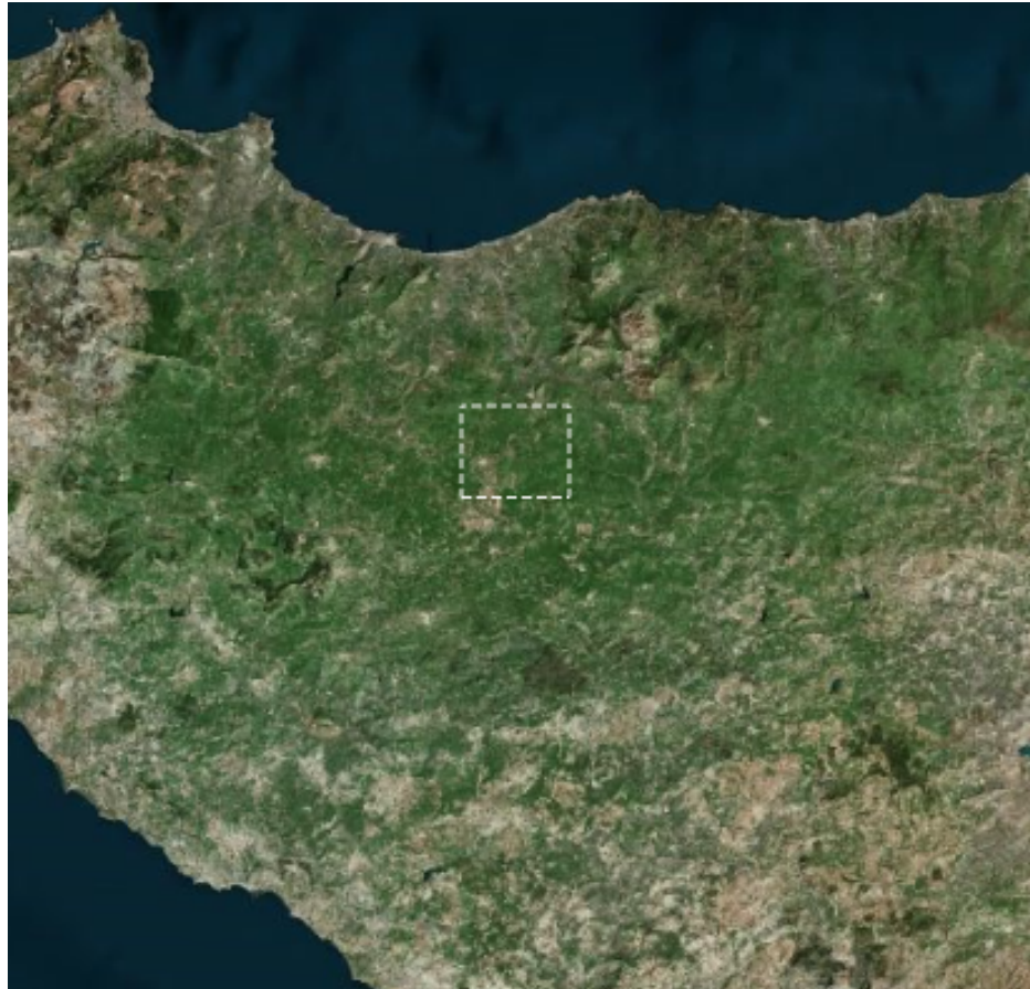
Figura 2-1: Inquadramento generale dell'area di progetto