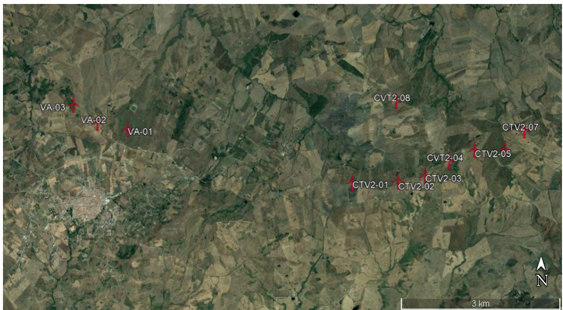
Figura 2-2: Configurazione proposta su ortofoto

Di seguito è riportato in formato tabellare un dettaglio sulla locazione delle WTG di nuova