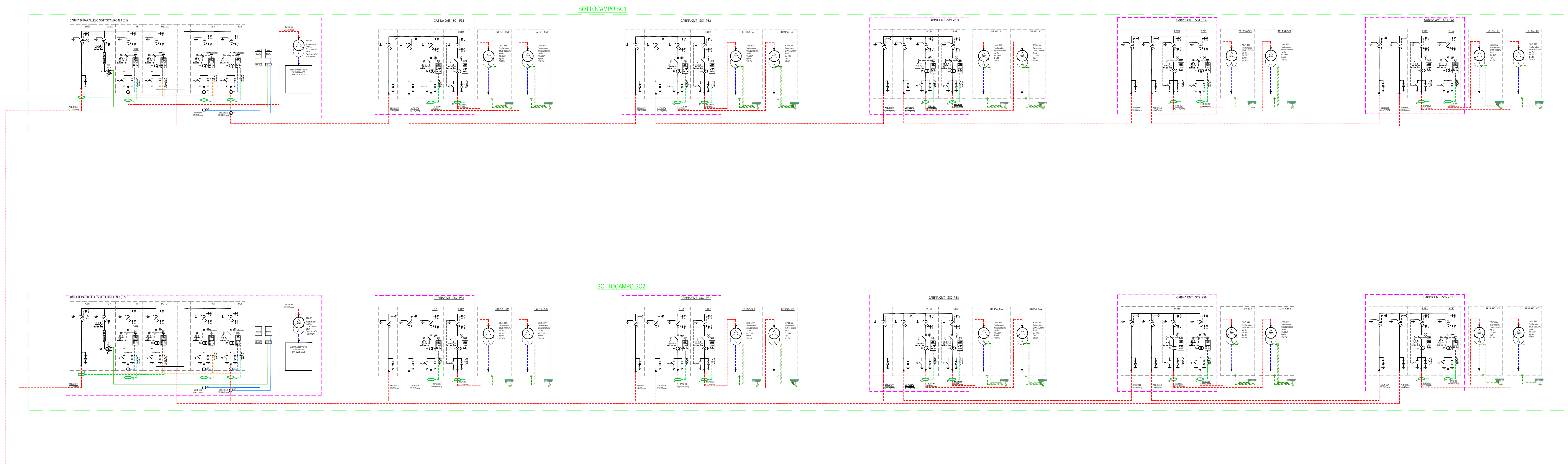
QMT CABINA CONSEGNA MT UTENTE RAPPRESENTAZIONE FUORI SCALA