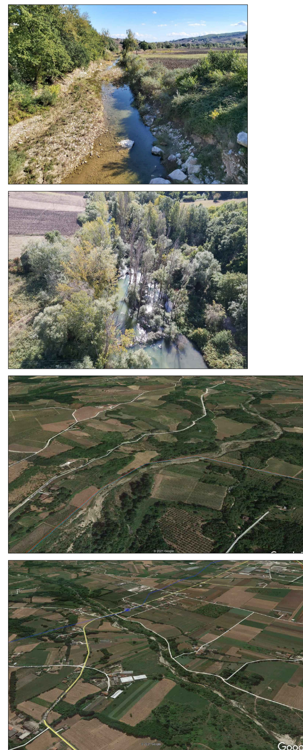
CORSI D'ACQUA MAGGIORI