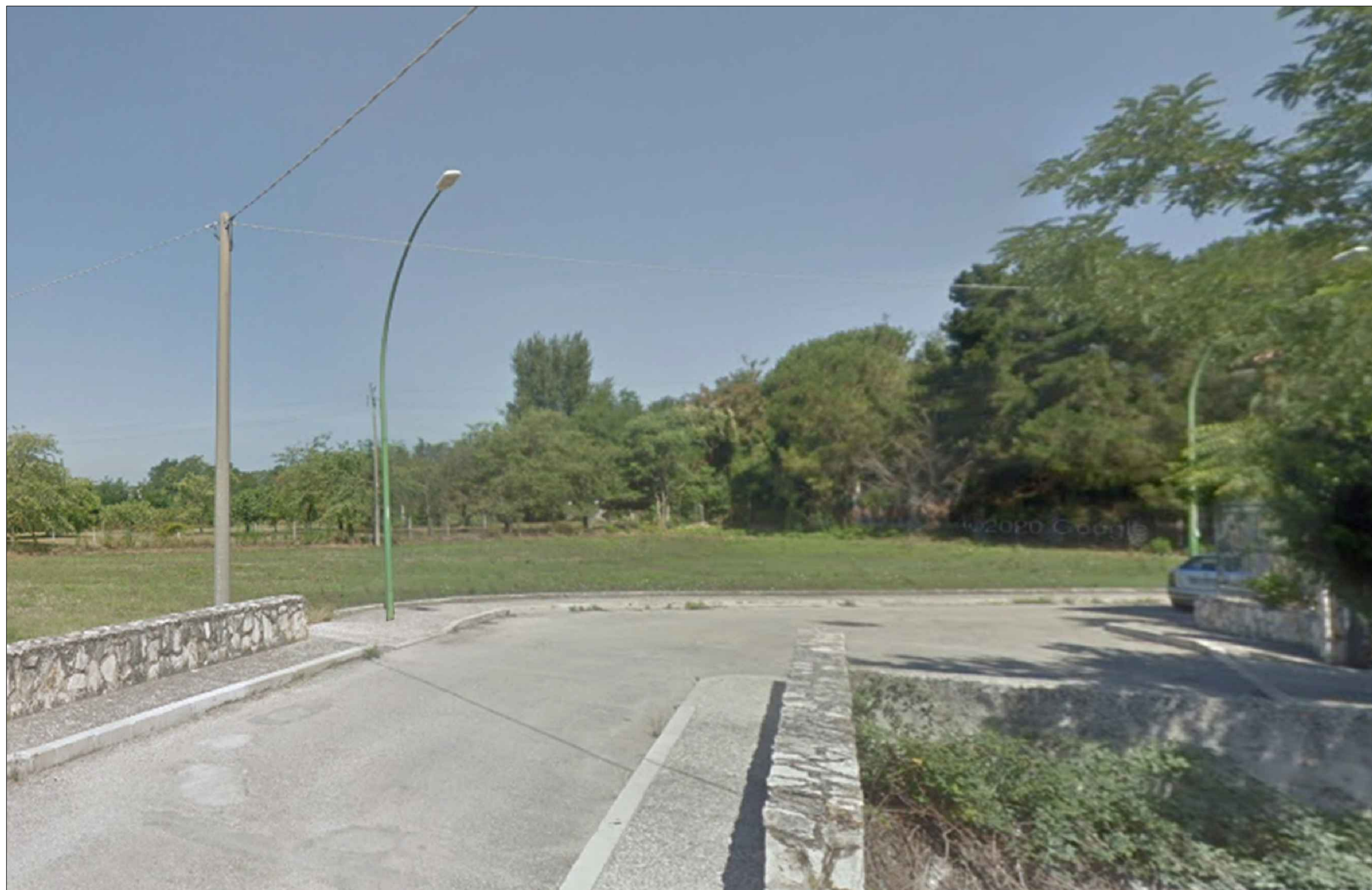
STATO DI FATTO - VISTA 1