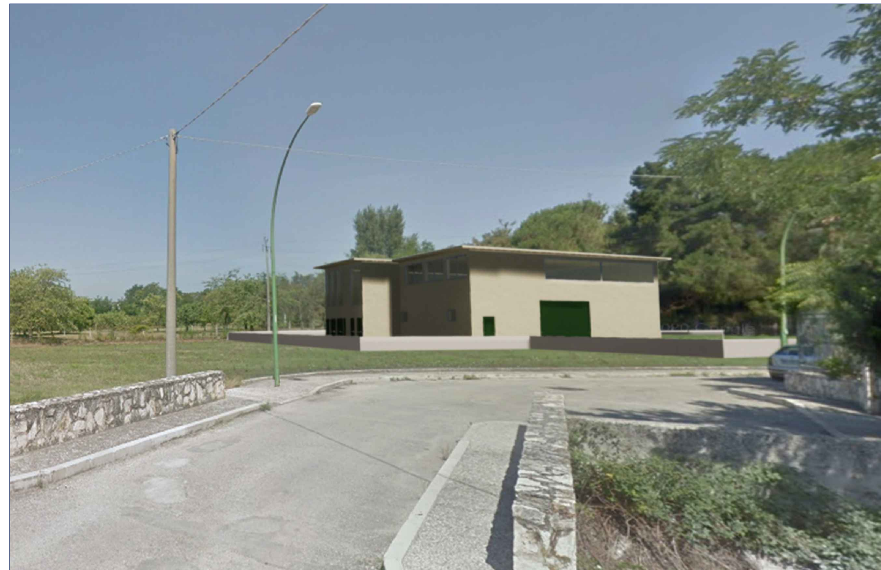
OPERA REALIZZATA - VISTA 1