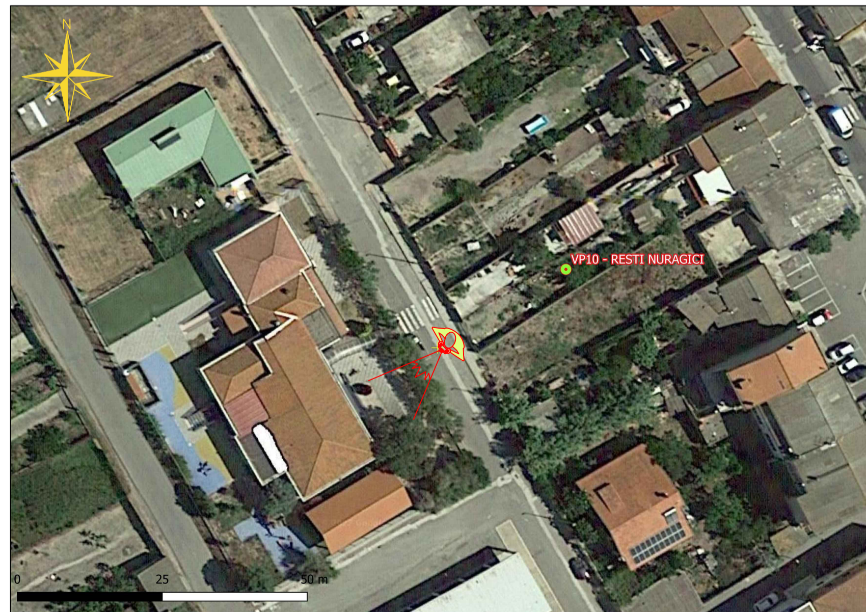
punto di presa fotografica