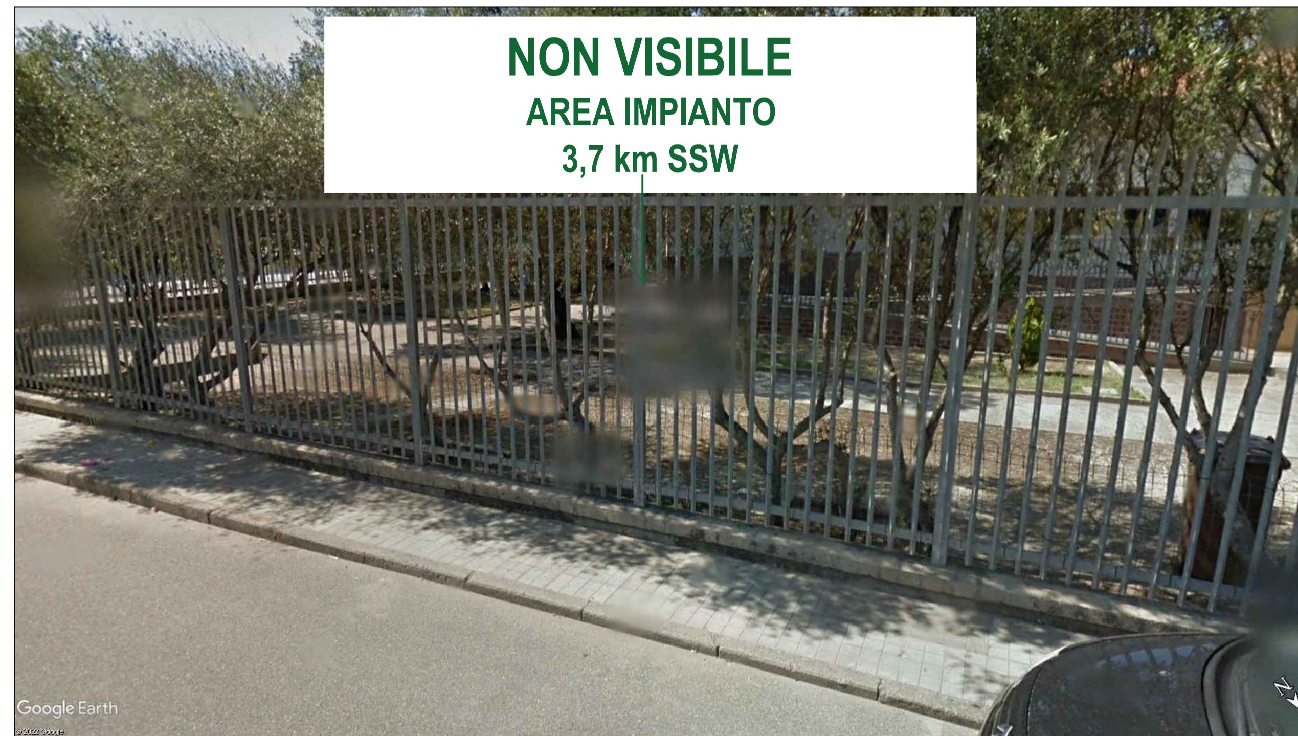
immagine di Google Street View