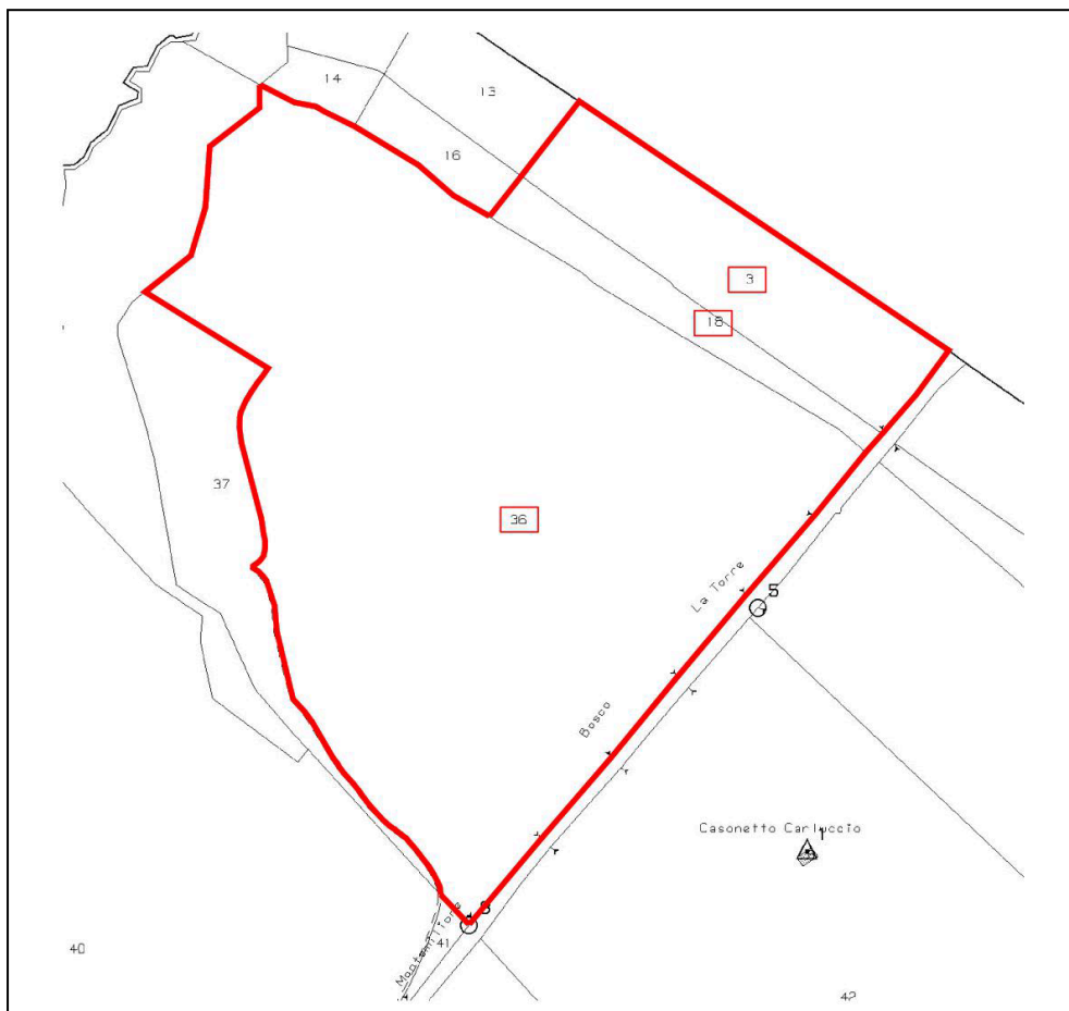
Estratto della planimetria catastale

Le aree interessate dalla realizzazione dell'impianto sono ubicate alla località Spinamara Sottana, nel comune di Montemilone (PZ), e sono censite al Catasto Terreni dello stesso comune al Foglio n. 36 particelle n° 3, 18 e 36 .