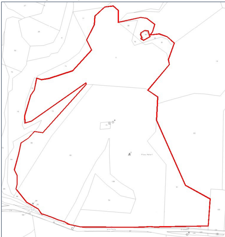
Estratto della planimetria catastale

Le aree interessate dalla realizzazione dell'impianto sono ubicate alla località Bolettieri, nel comune di Grottole (MT), e sono censite al Catasto Terreni dello stesso comune al Foglio n. 11 particelle n° 18, 45, 54, 60, 61, 76, 80, 81, 93 e 108 .