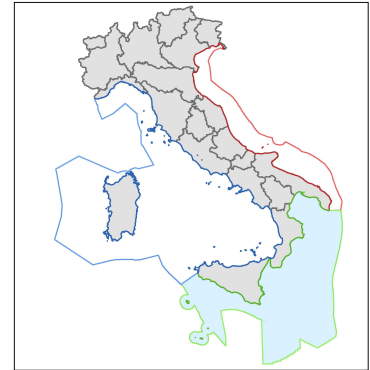
Carta delle aree EBSA e Ambiti Prioritari con valenza di tutela ambientale - SUB-AREA IMC/4 Scala 1: 250.000