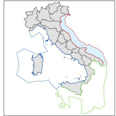
Carta dell'area EBSA A/4 ADRIATICO CENTRALE Scala 1: 250.000