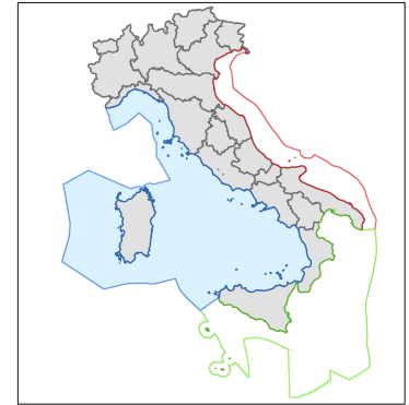
Carta delle aree EBSA e Ambiti Prioritari con valenza di tutela ambientale Scala 1: 1.000.000