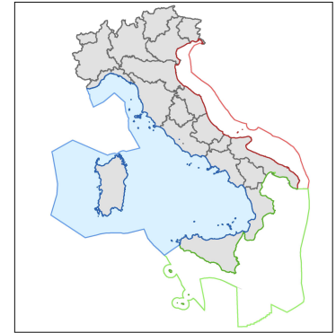
Carta delle aree EBSA e Ambiti Prioritari con valenza di tutela ambientale - SUB-AREA MO/10 Scala 1: 600.000