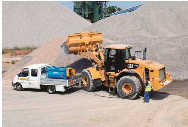
Esempio di rifornimento nell'area di cantiere: da evitare

E' importante porre attenzione alle caratteristiche degli oli disarmanti, se impiegati nella costruzione, allo scopo di scegliere preferibilmente prodotti biodegradabili e atossici.