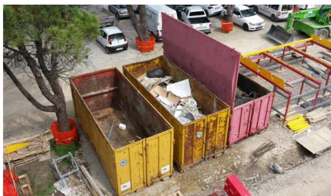
Esempio di contenitore per la raccolta dei rifiuti coperto.

Dovrà essere fornito l'elenco delle ditte che trattano i rifiuti prodotti dalle lavorazioni, provvedendo al necessario aggiornamento.