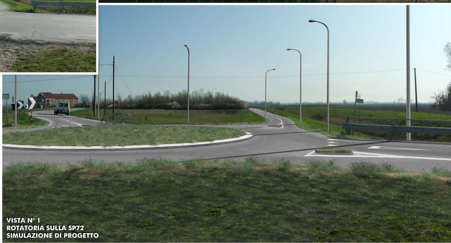
VISTA N° 1 ROTATORIA SULLA SP72 SIMULAZIONE DI PROGETTO