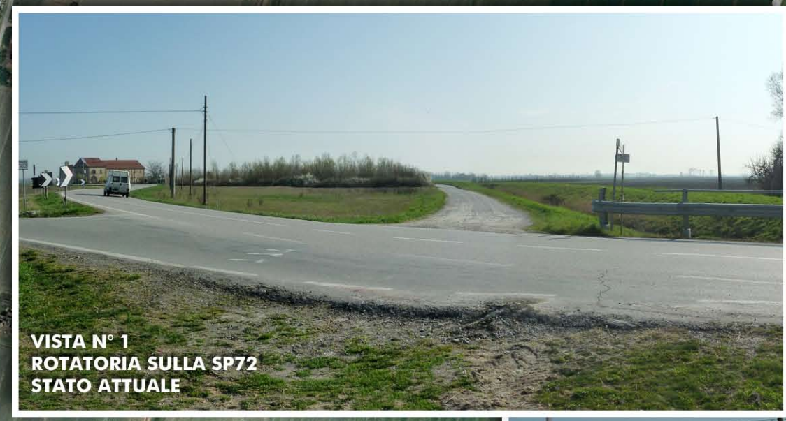
VISTA N° 1 ROTATORIA SULLA SP72 STATO ATTUALE