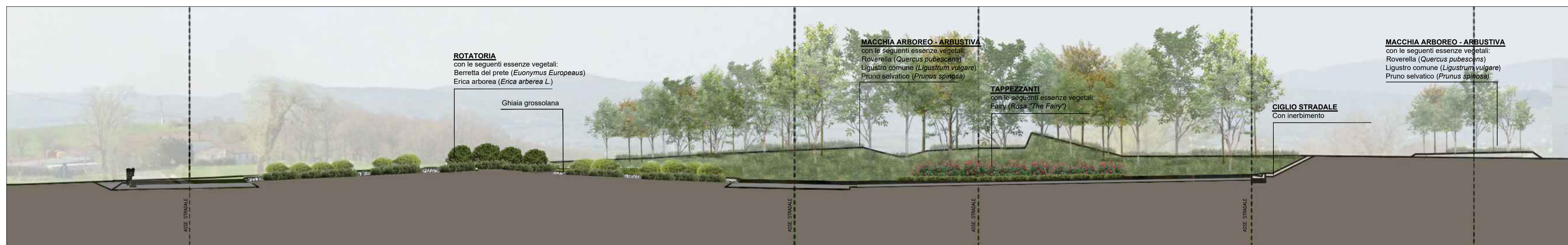
ROTATORIA - SEZIONE AA'