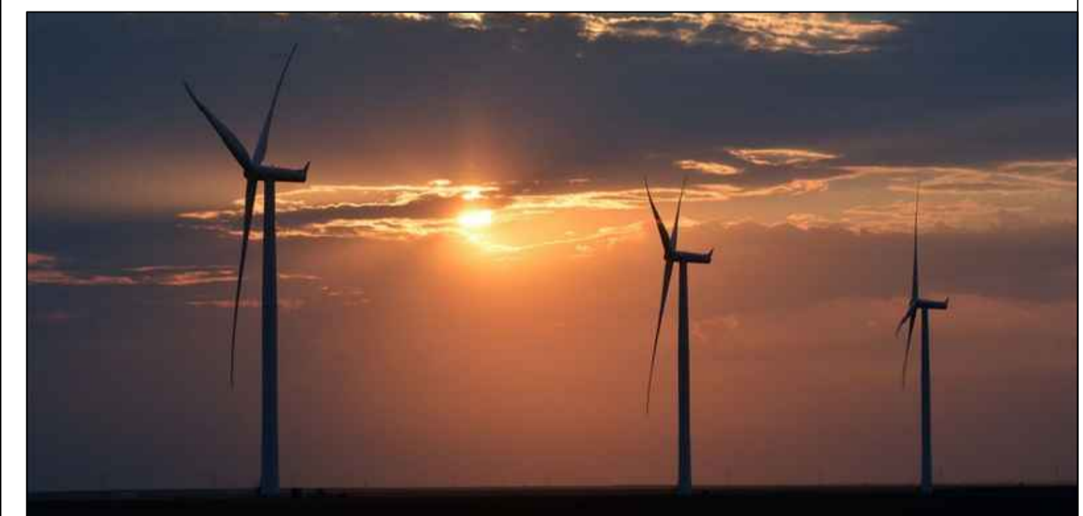
REGIONE BASILICATA - PROVINCIA DI POTENZA - COMUNE DI VENOSA E MONTEMILONE

Titolo del progetto PROGETTO DI COSTRUZIONE ED ESERCIZIO DI UN IMPIANTO EOLICO DELLA POTENZA DI 99,20 MWp DA REALIZZARSI NEL COMUNE DI VENOSA (PZ), CON LE RELATIVE OPERE DI CONNESSIONE ELETTRICHE CHE INTERESSANO IL COMUNE DI MONTEMILONE DENOMINATO "BOREANO"