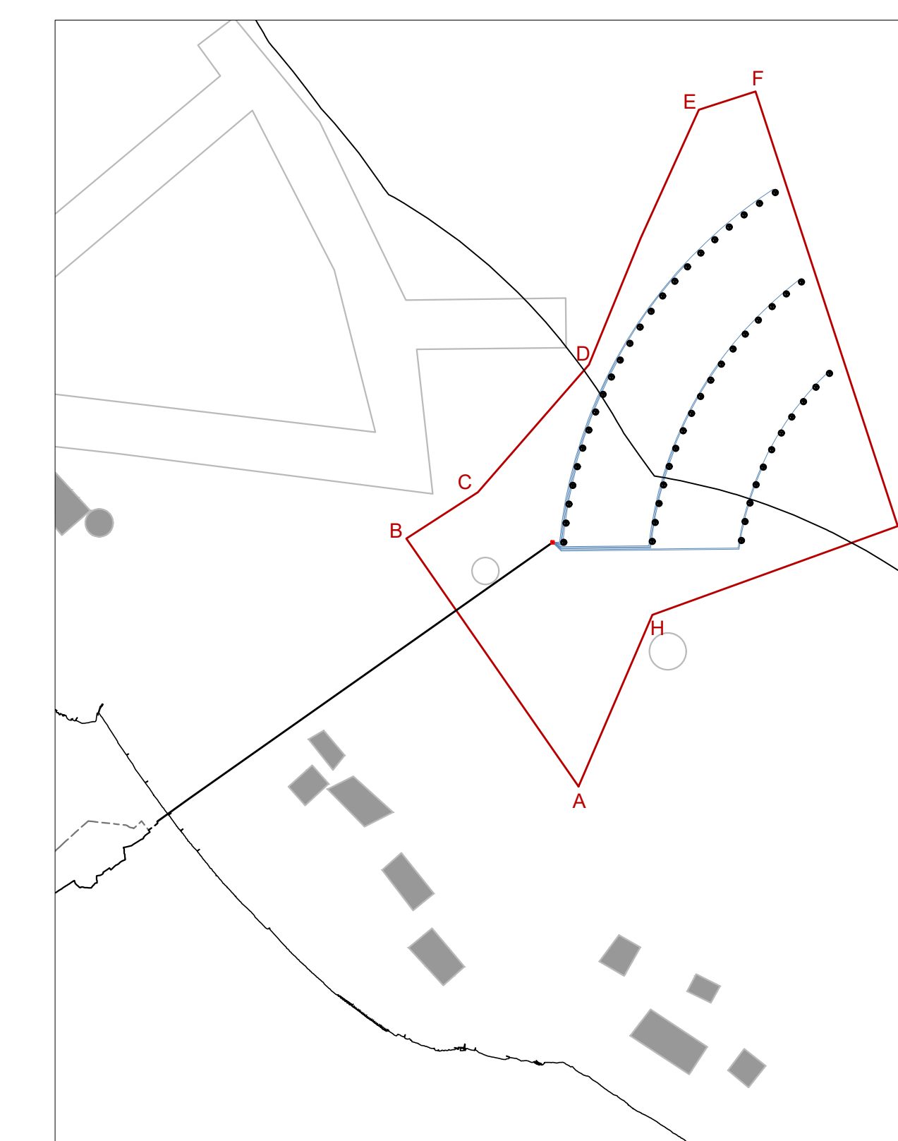
LAYOUT B_ CONCESSIONI PER ALLEVAMENTI MITILI