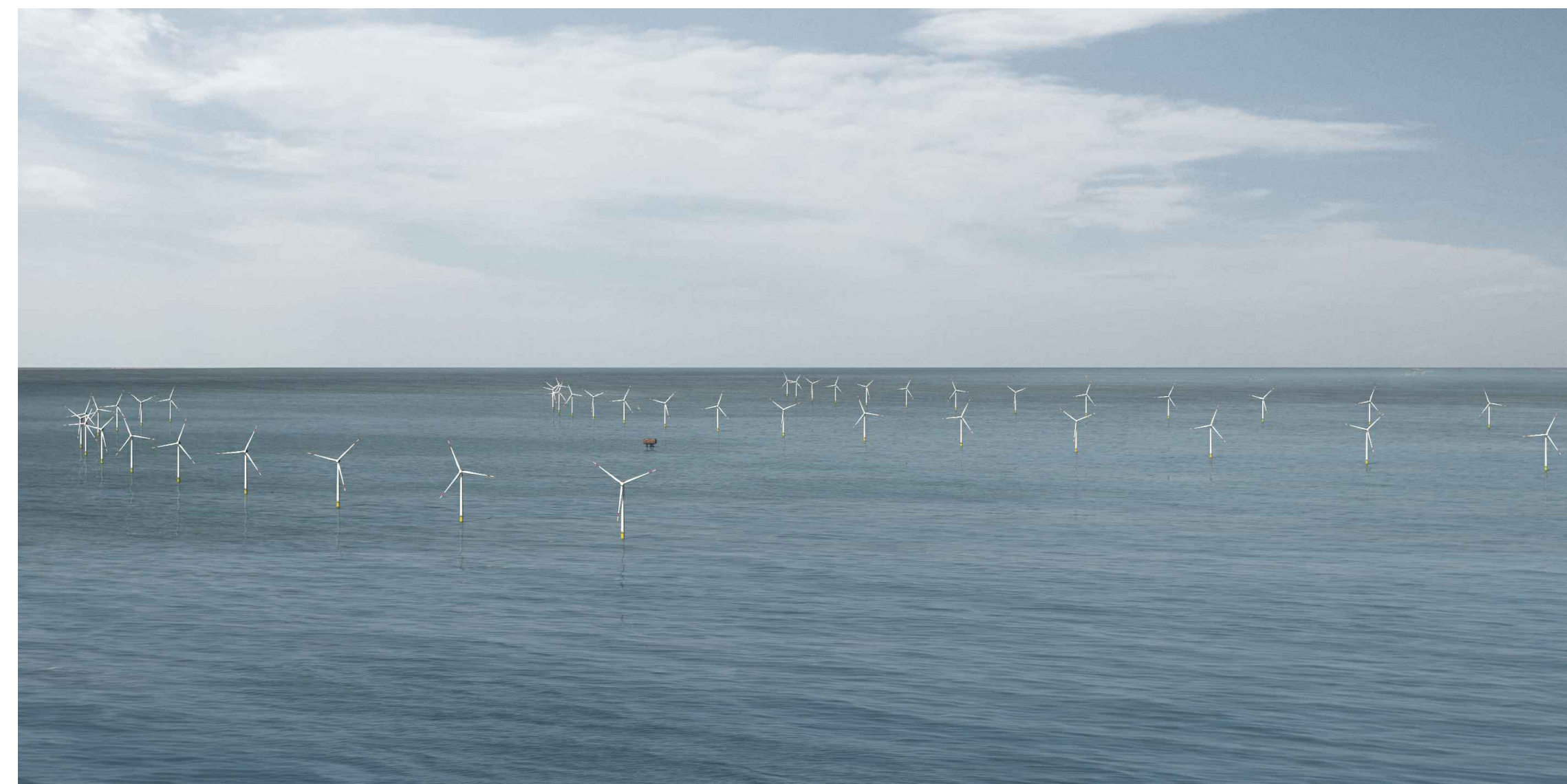
LAYOUT A _ VISTE AEREE DEL PROGETTO