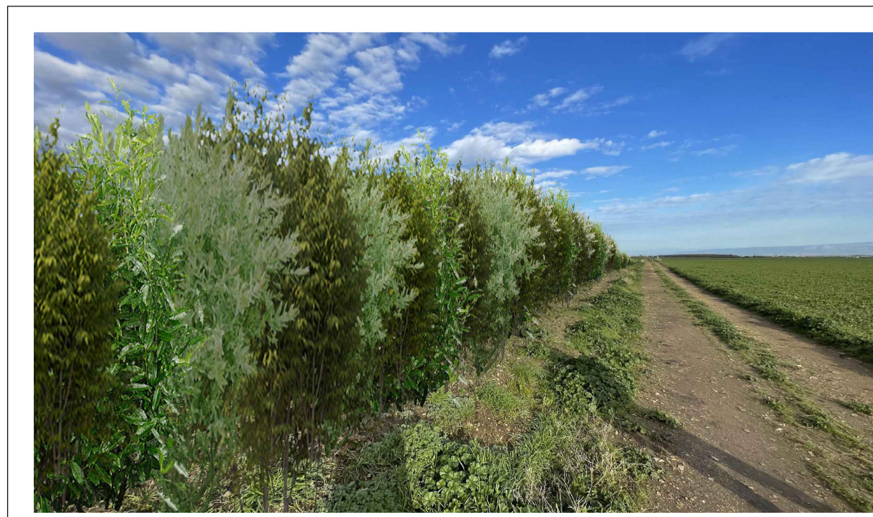
FOTOINSERIMENTO 3 - STATO DI PROGETTO