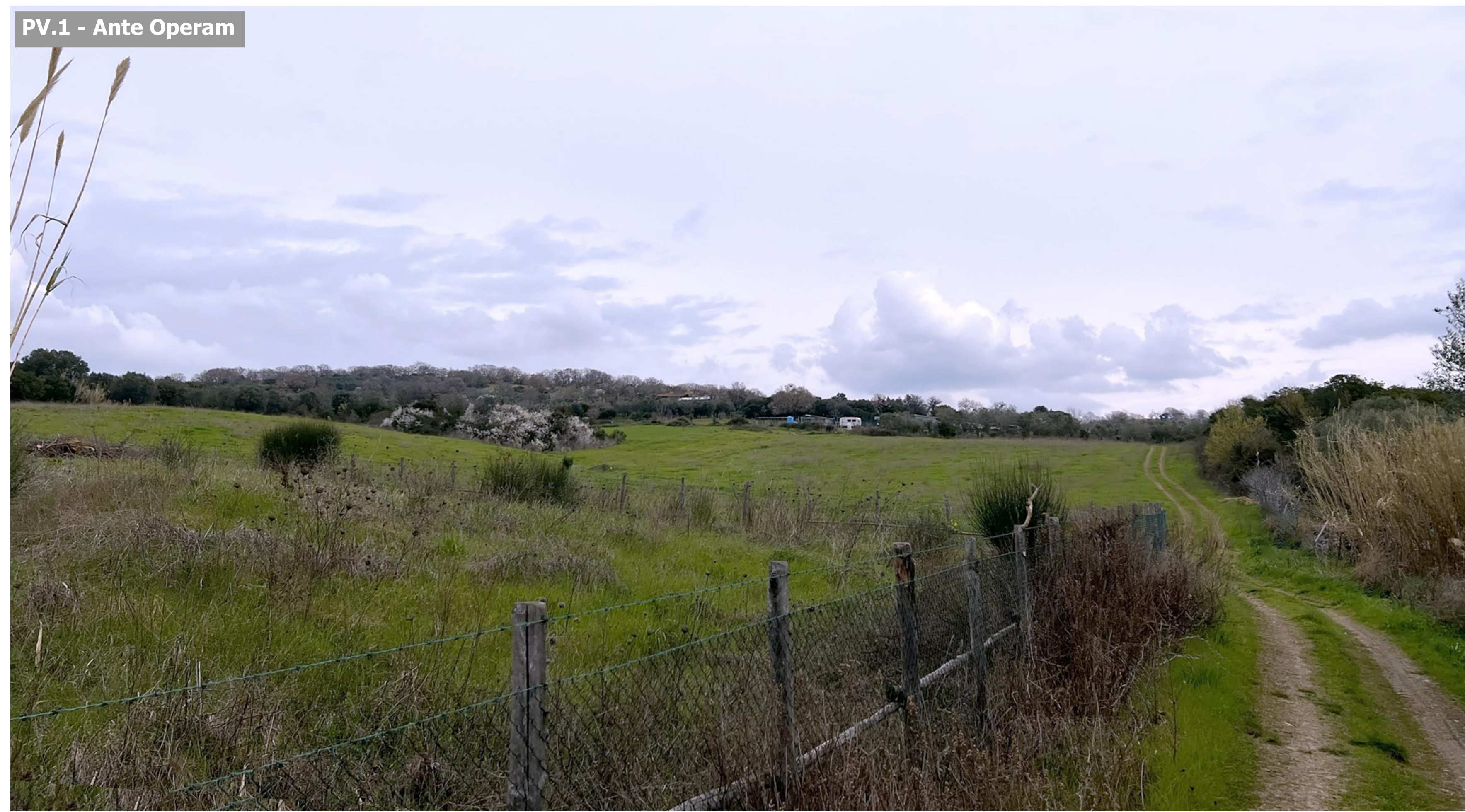
PV.1 - Ante Operam