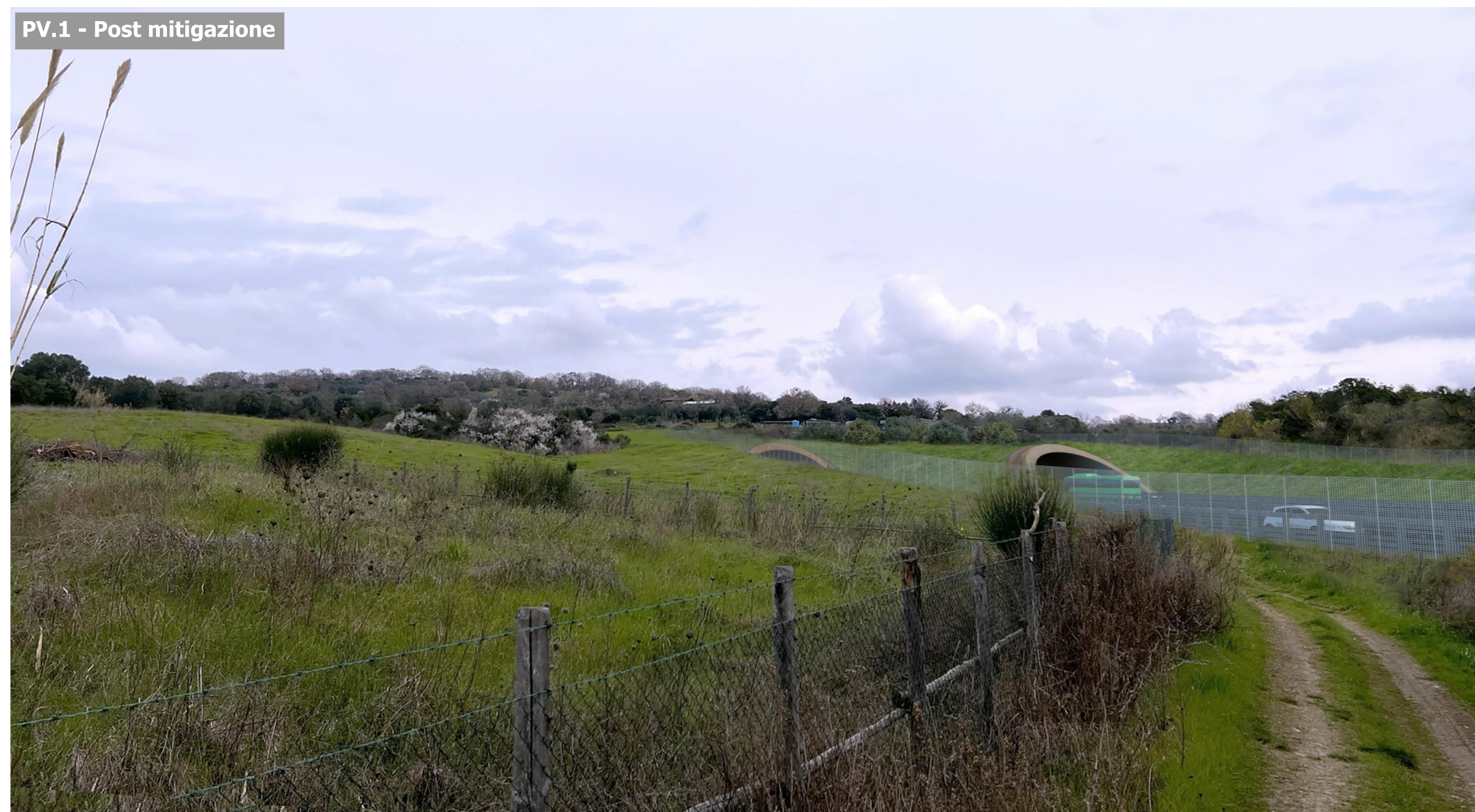
PV.1 - Post mitigazione