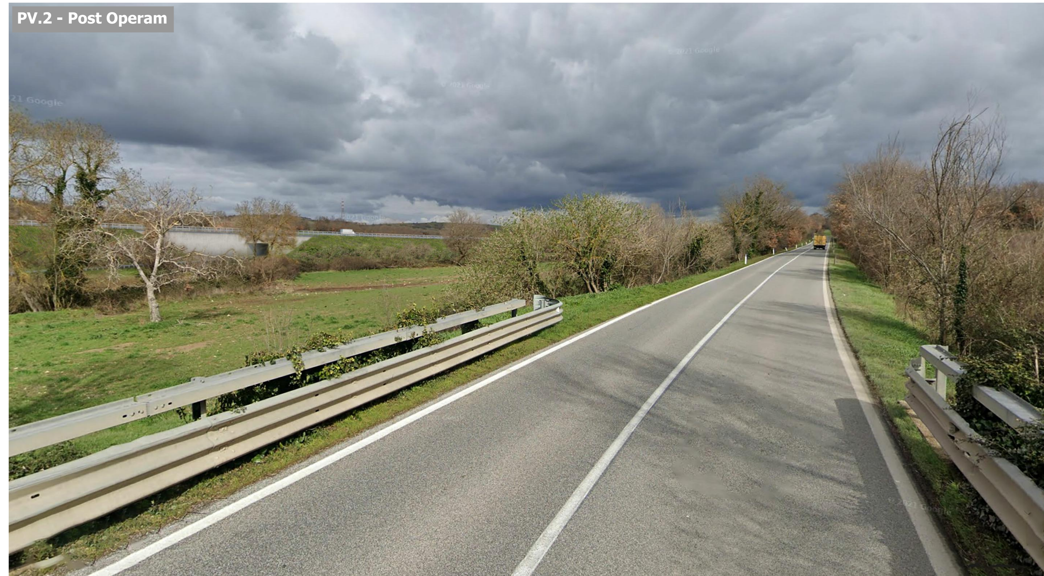
PV.2 - Post Operam