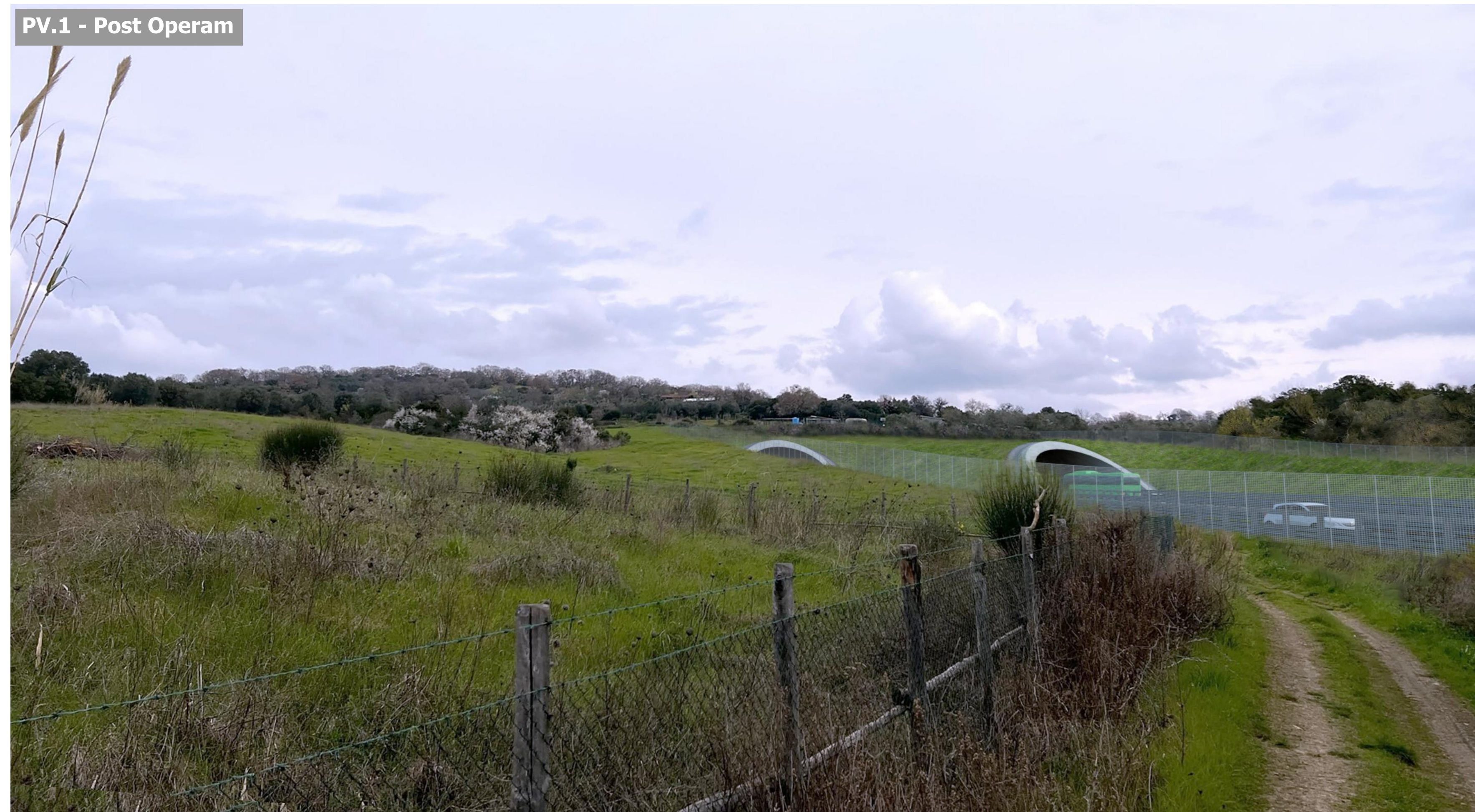
PV.1 - Post Operam