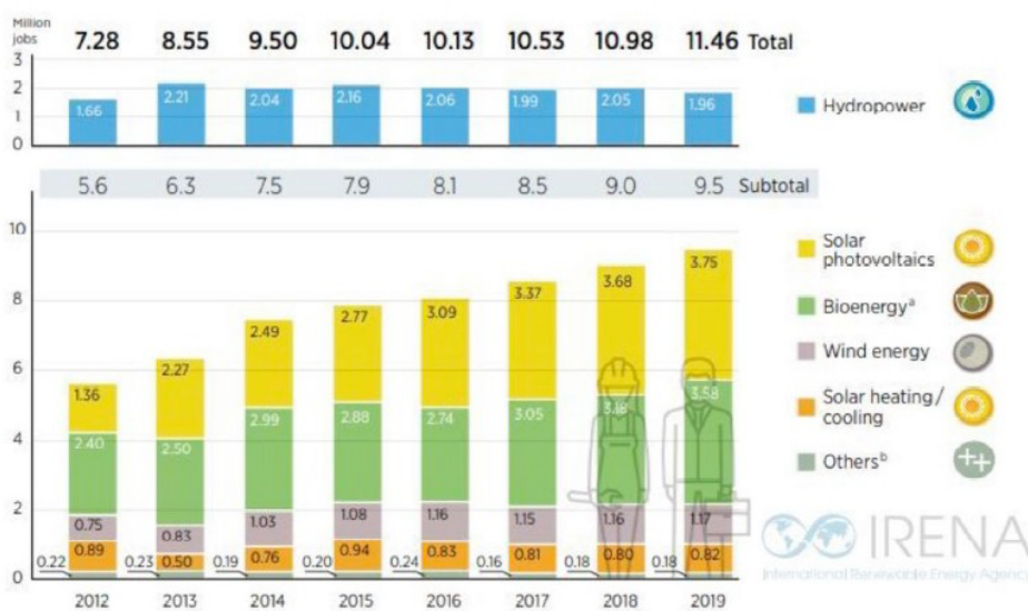
Dati occupazionali nel settore rinnovabile negli ultimi anni

Il settore con il maggior numero di occupati è il solare-fotovoltaico, che registra oltre 3 milioni di lavoratori impiegati. A seguire troviamo il settore dei bio combustibili liquidi (1,7 milioni di occupati), il grande idroelettrico (1,5 milioni di posti di lavoro) e il settore eolico, che occupa 1,1 milioni di lavoratori. Secondo il rapporto "Renewable Energy and Jobs - Annual Review" di Irena, Agenzia internazionale per le energie rinnovabili, nel 2019 nel mondo sono state impiegate undici milioni e mezzo di persone nel settore delle energie pulite, in aumento rispetto agli 11 milioni del 2018 e ai 10,3 milioni del 2017. In Europa i paesi che hanno un maggior numero di lavoratori in questo ambito sono la Germania, in particolare nell'eolico, e la Francia (biomasse).