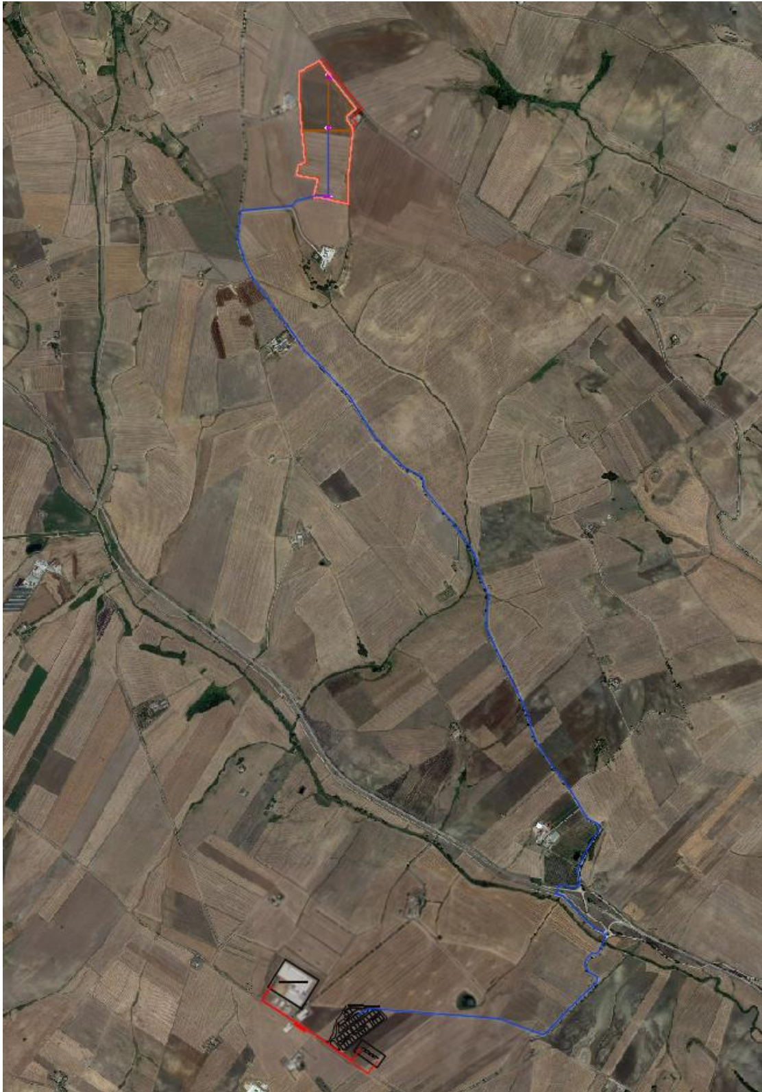
Figura 2 - Inquadramento dell'impianto FV e relative opere di connessione su ortofoto