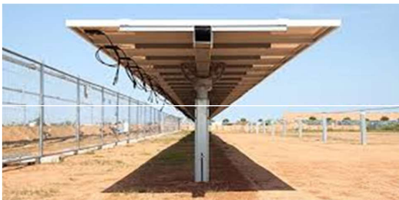
Figura 5 - particolare d'installazione