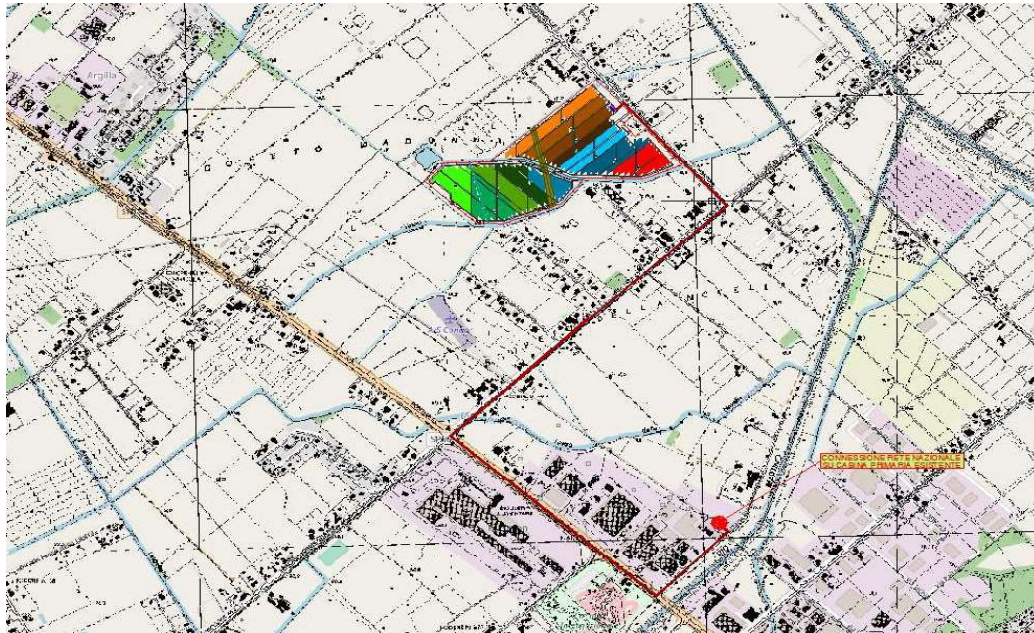
Figura 3 - rappresentazione dell'intervento su base CTR

ideona schermatura della visuale dalla strada Provinciale 54 – Capogrossa. Nella zona di confine a Sud/est è presente un ulteriore ridotta porzione di area boscata che, comunque, risulta esclusa da ogni tipo di intervento.