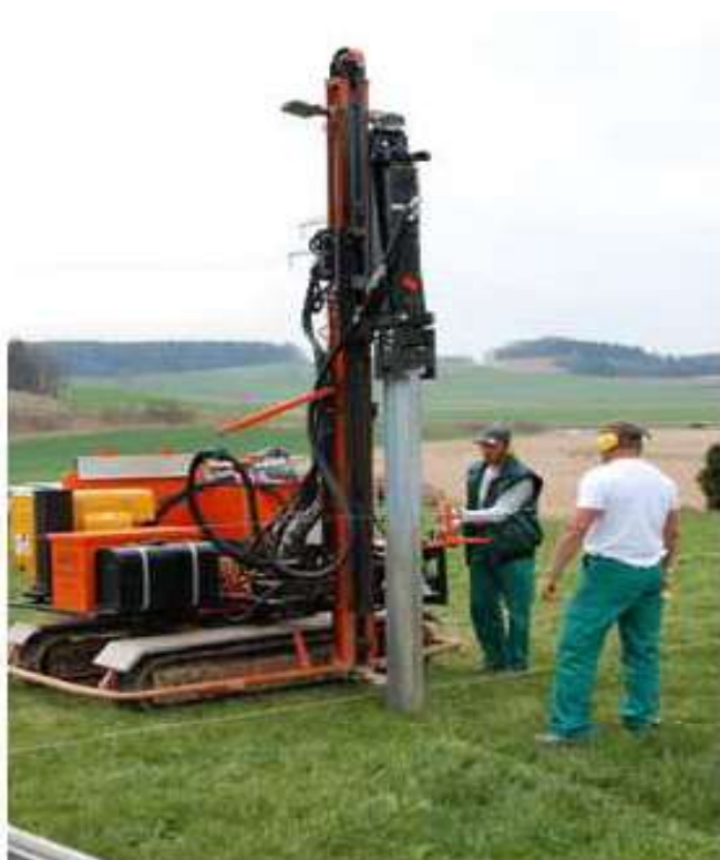
Figura 6 - particolare d'installazione