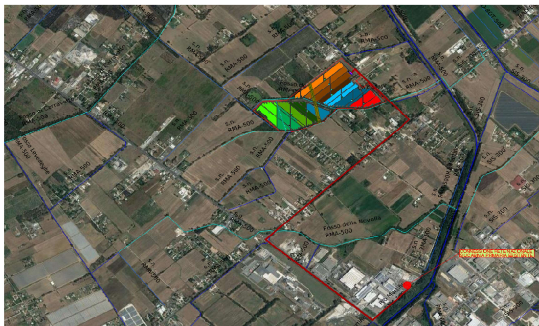
Figura 2 - Ortofoto satellitare con la rappresentazione dell'intervento