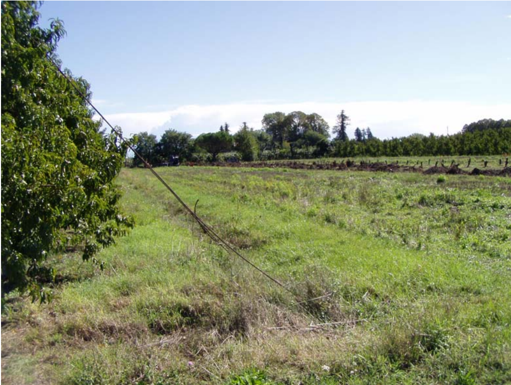
Foto 6 Area della postazione da Nord-Ovest; oltre gli alberi più alti sullo sfondo i primi fabbricati di S.Pietro in Vincoli