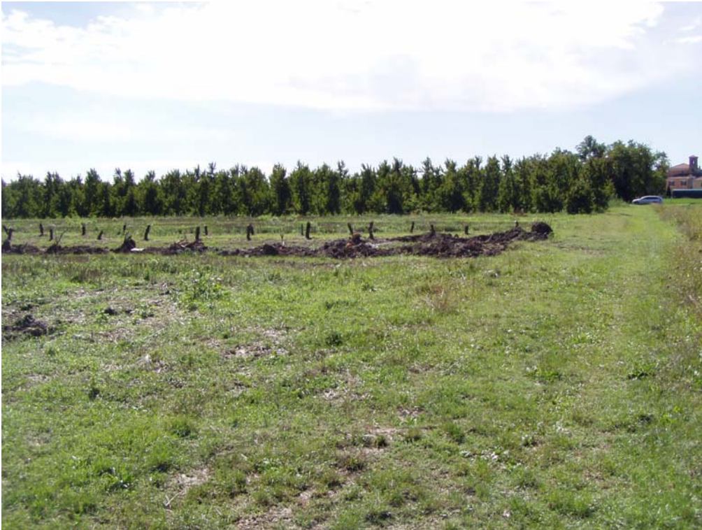
Foto 2 – Area postazione da nord. Sullo sfondo via Angaia e il Convento dei Padri Saveriani