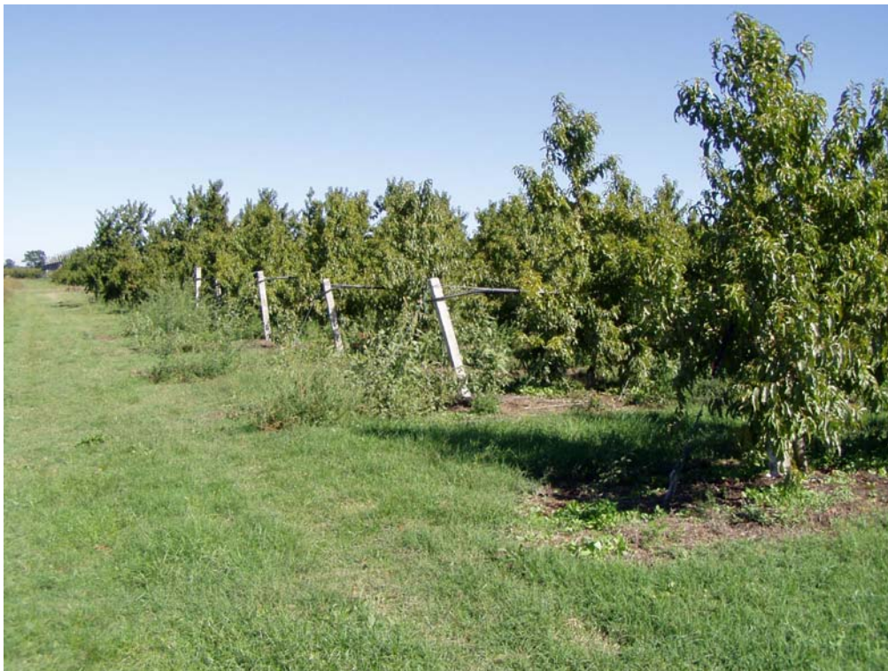
Foto 3 – Particolare del frutteto che occupa l'area di postazione