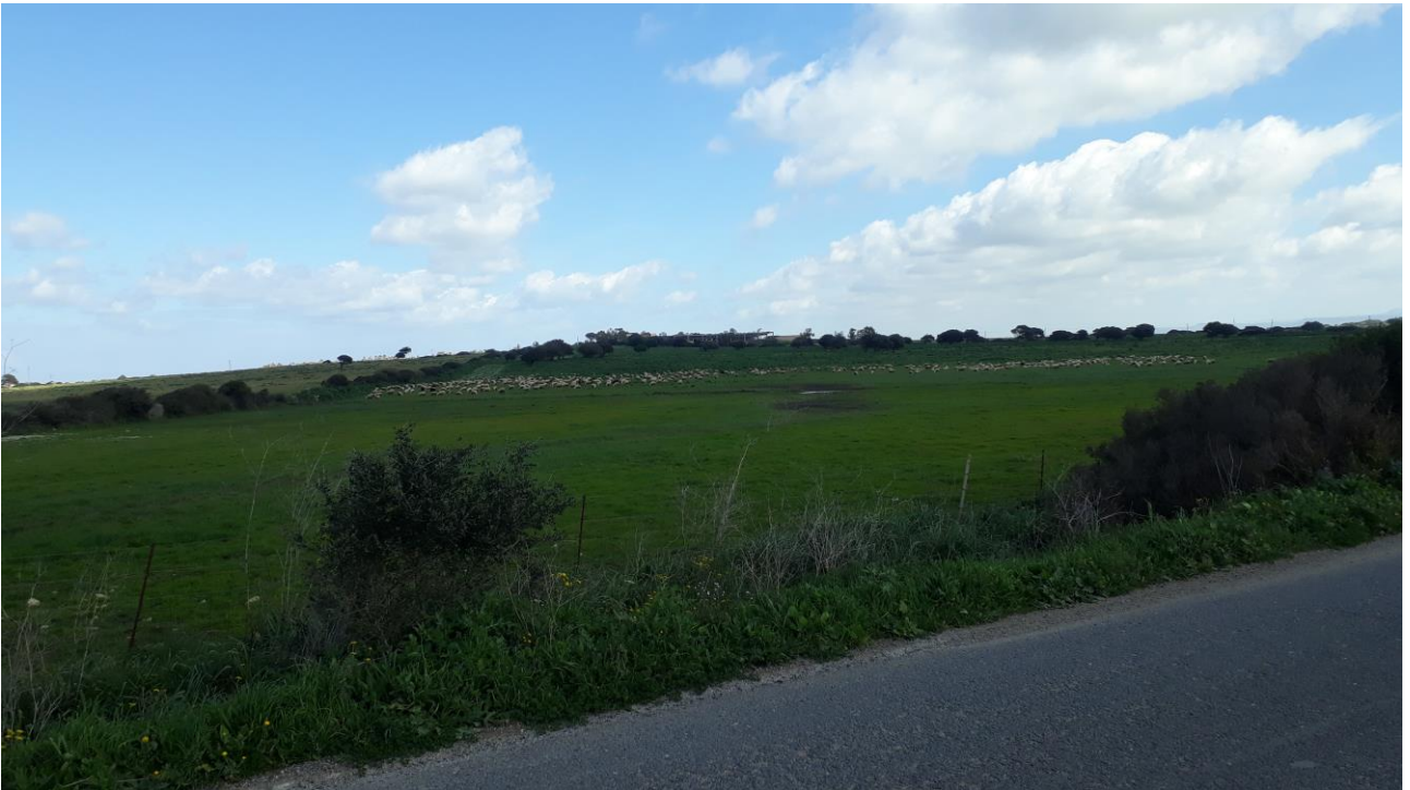
Figura 8 - foto 905