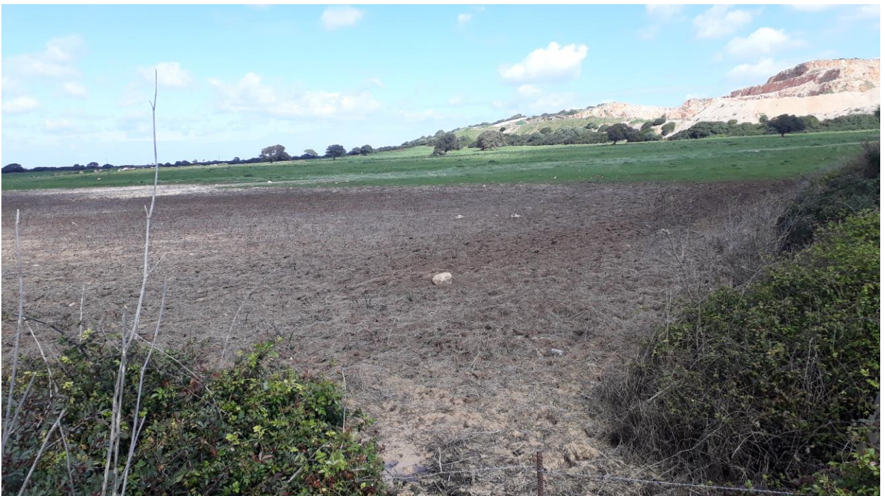
Figura 10 - foto 101