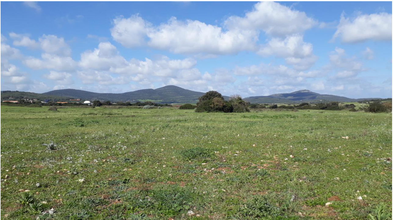
Figura 12 - foto 156