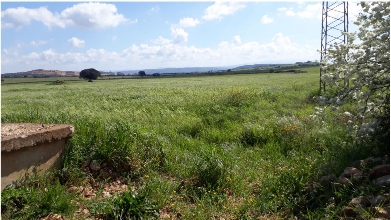
Figura 16 - foto 851