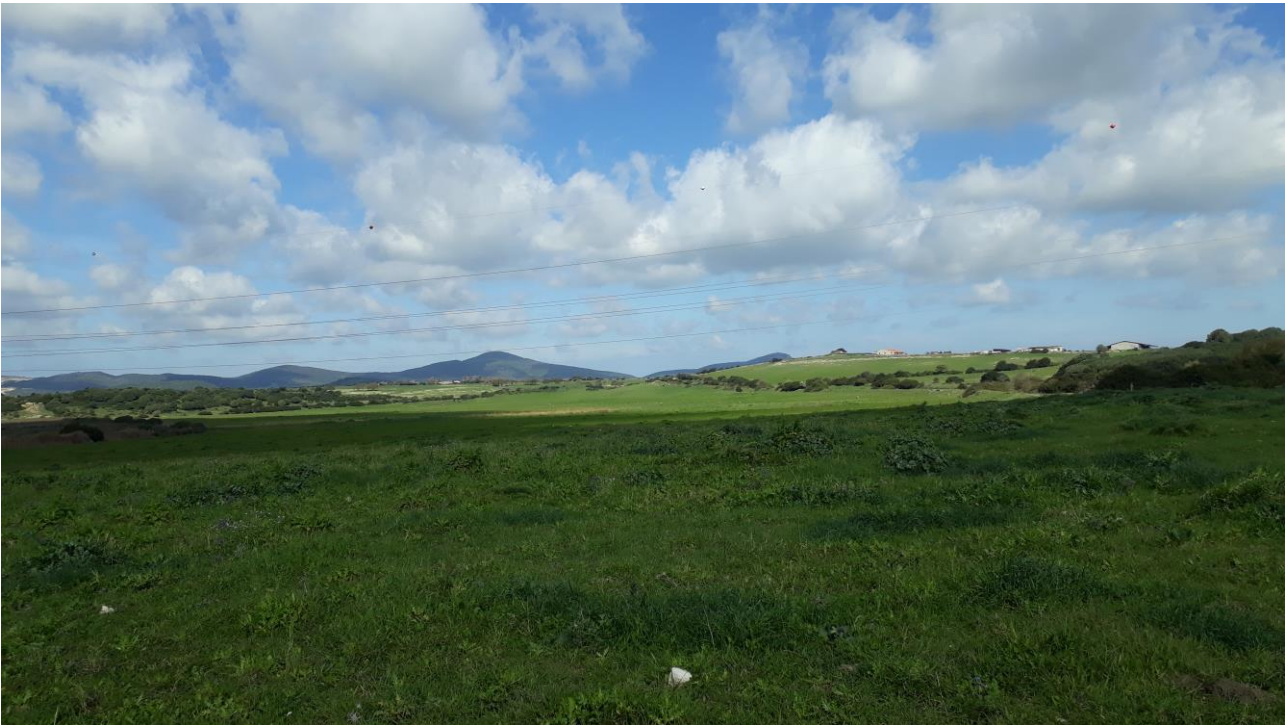
Figura 2 - foto 947