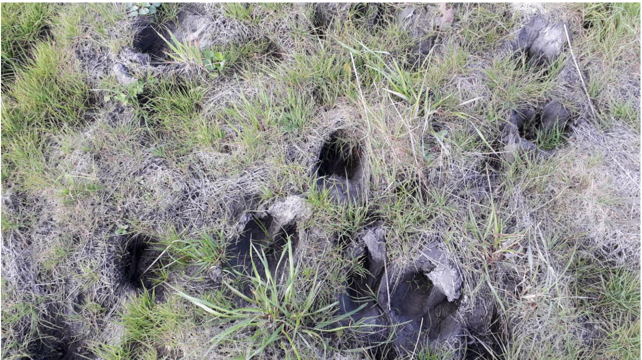
Figura 4 - foto 135