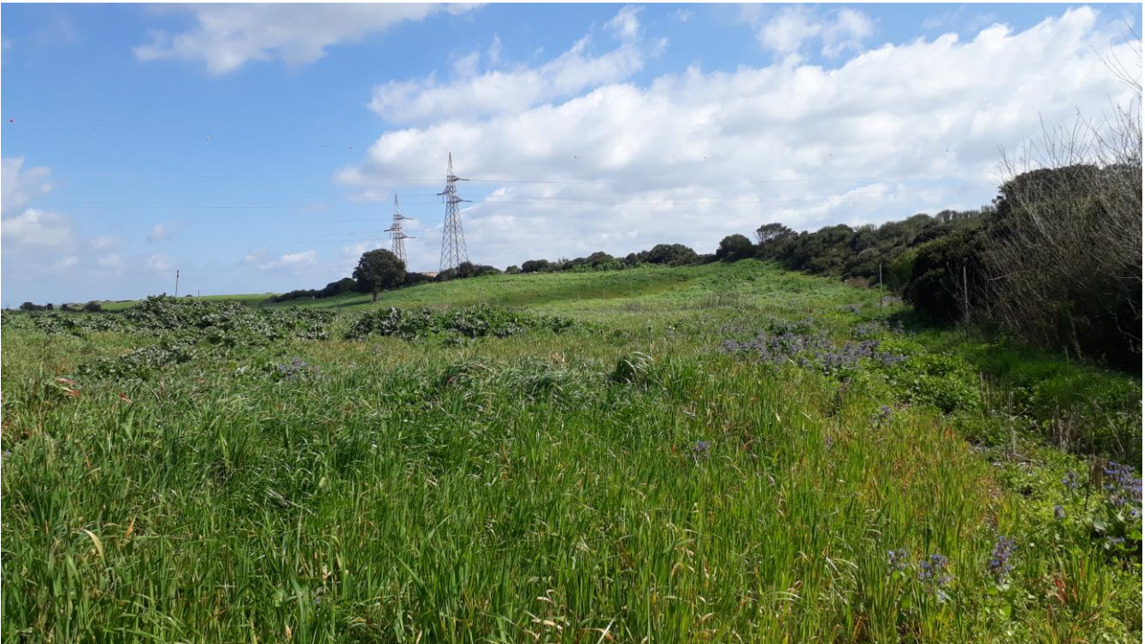
Figura 6 - foto 242