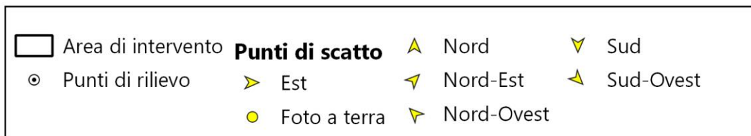
Mappa 1 - Distribuzione dei rilievi (periodo: marzo-aprile 2021)