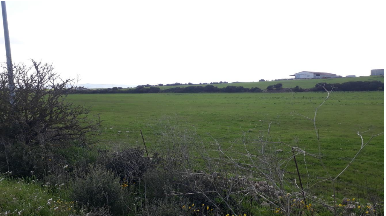
Figura 7 - foto 856