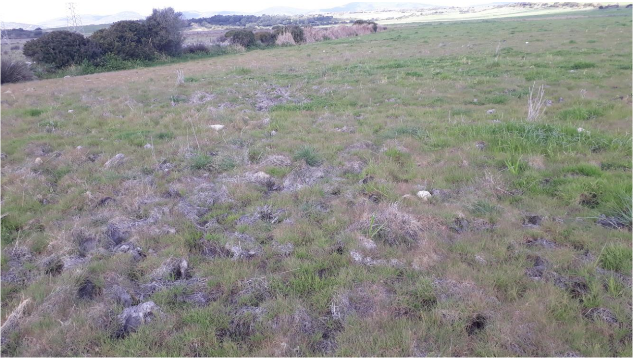
Figura 5 - foto 140