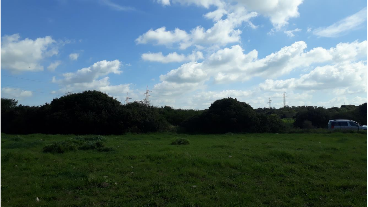
Figura 3 - foto 955