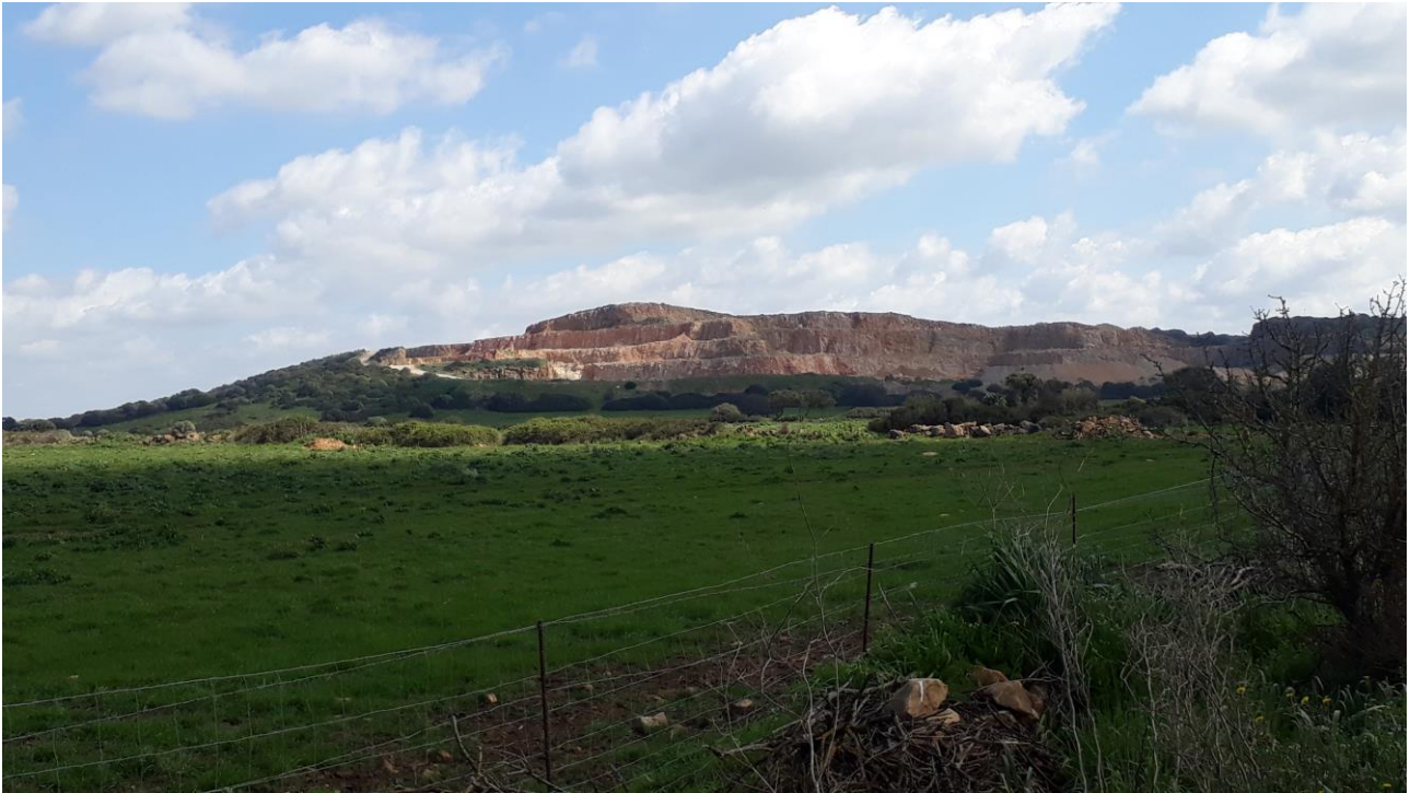
Figura 11 - foto 713