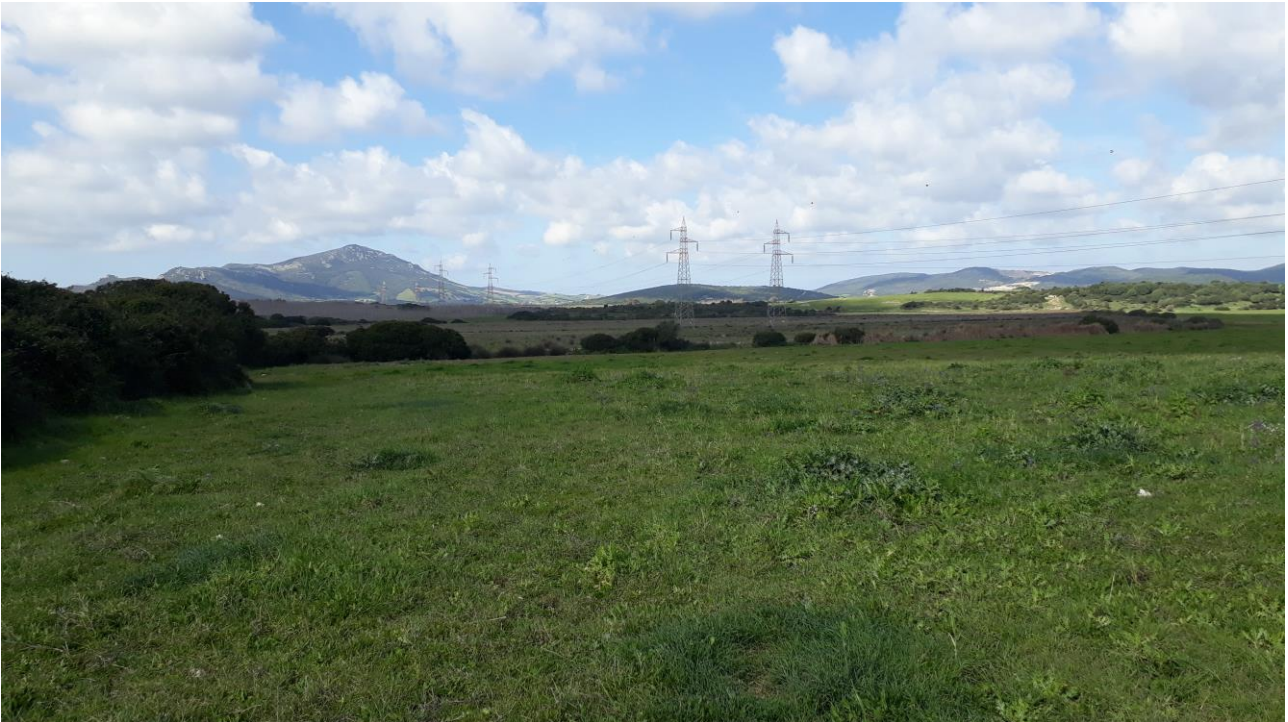
Figura 1 - foto 952