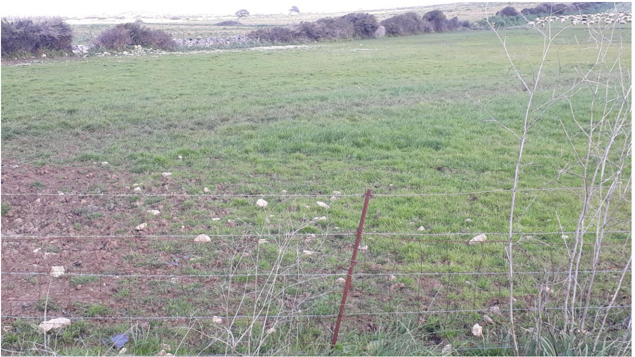
Figura 9 - foto 919