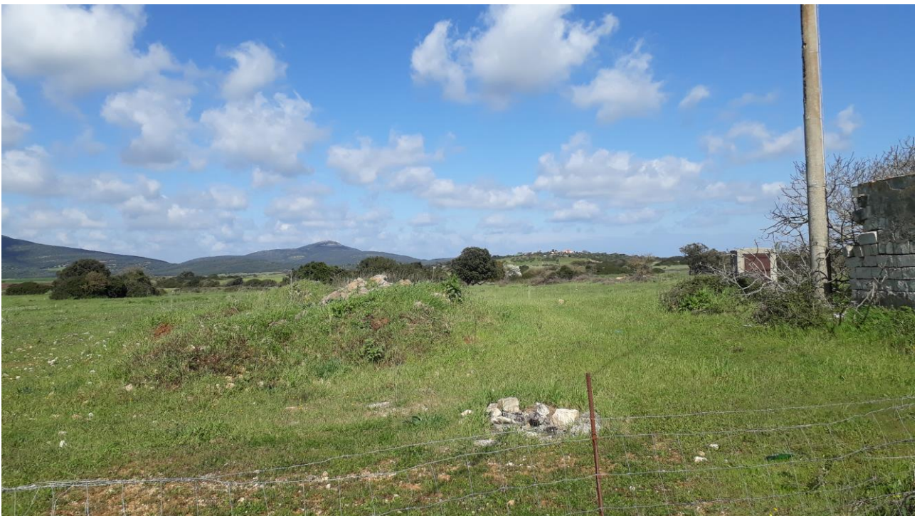
Figura 14 - foto 740