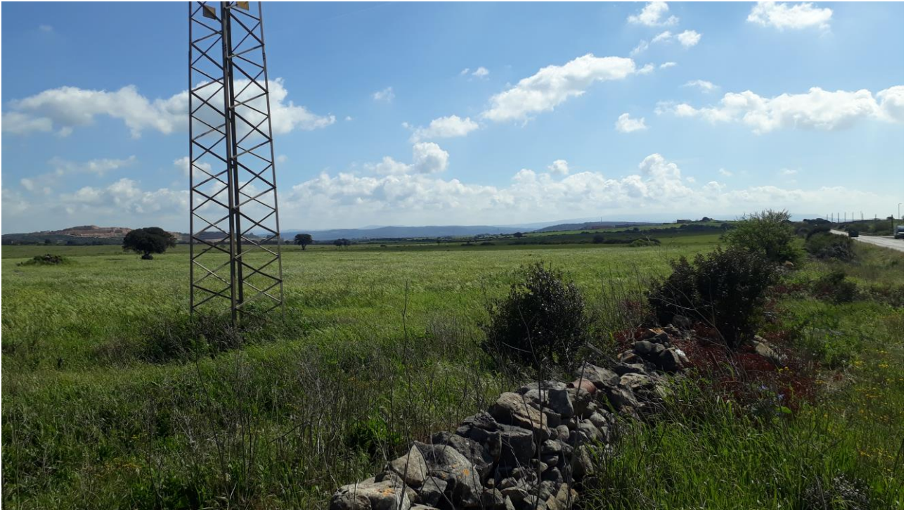
Figura 15 - foto 832