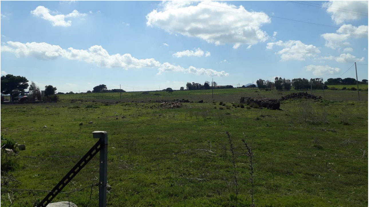
Figura 13 - foto 715