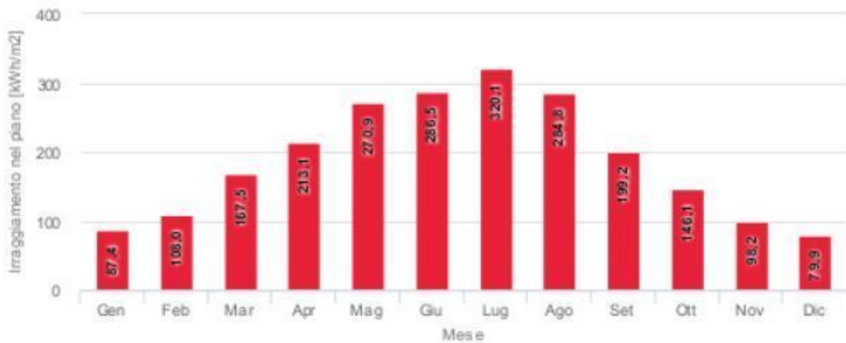
Figura 2 - Media mensile di irradiazione globale per metro quadro sul piano dei pannelli fotovoltaici.