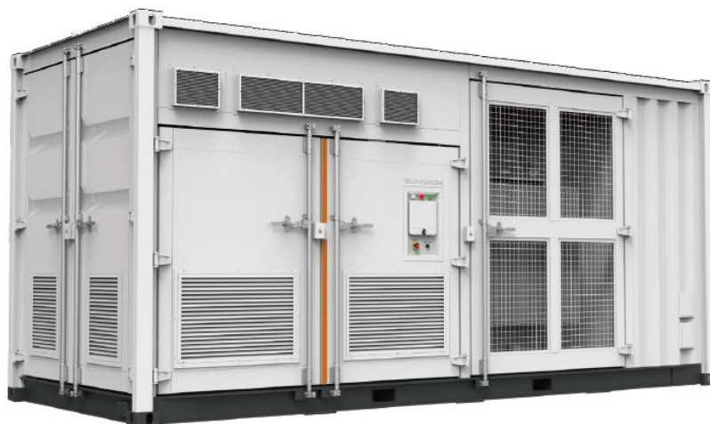
Fig. 2. Cabina container prefabbricata

Per la raccolta dell'energia di ogni campo ed il convogliamento verso lo stallo utente, verranno realizzate n. 20 cabine tipo container da 20' di trasformazione dell'energia in MT dislocate lungo le strade di servizio dell'area di progetto. Le cabine saranno in strutture prefabbricate aventi le dimensioni pari 6,058 m x 2,896 m x 2,438 m.