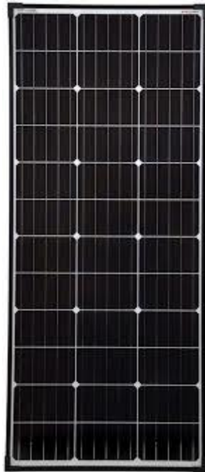
Fig. 1. Esempio di pannello da 156 (2x78) celle