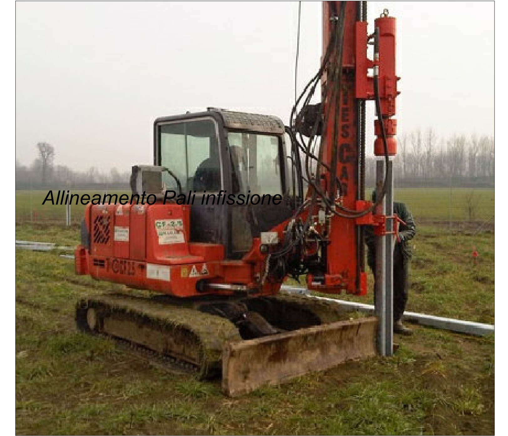
Allineamento Pali infissione