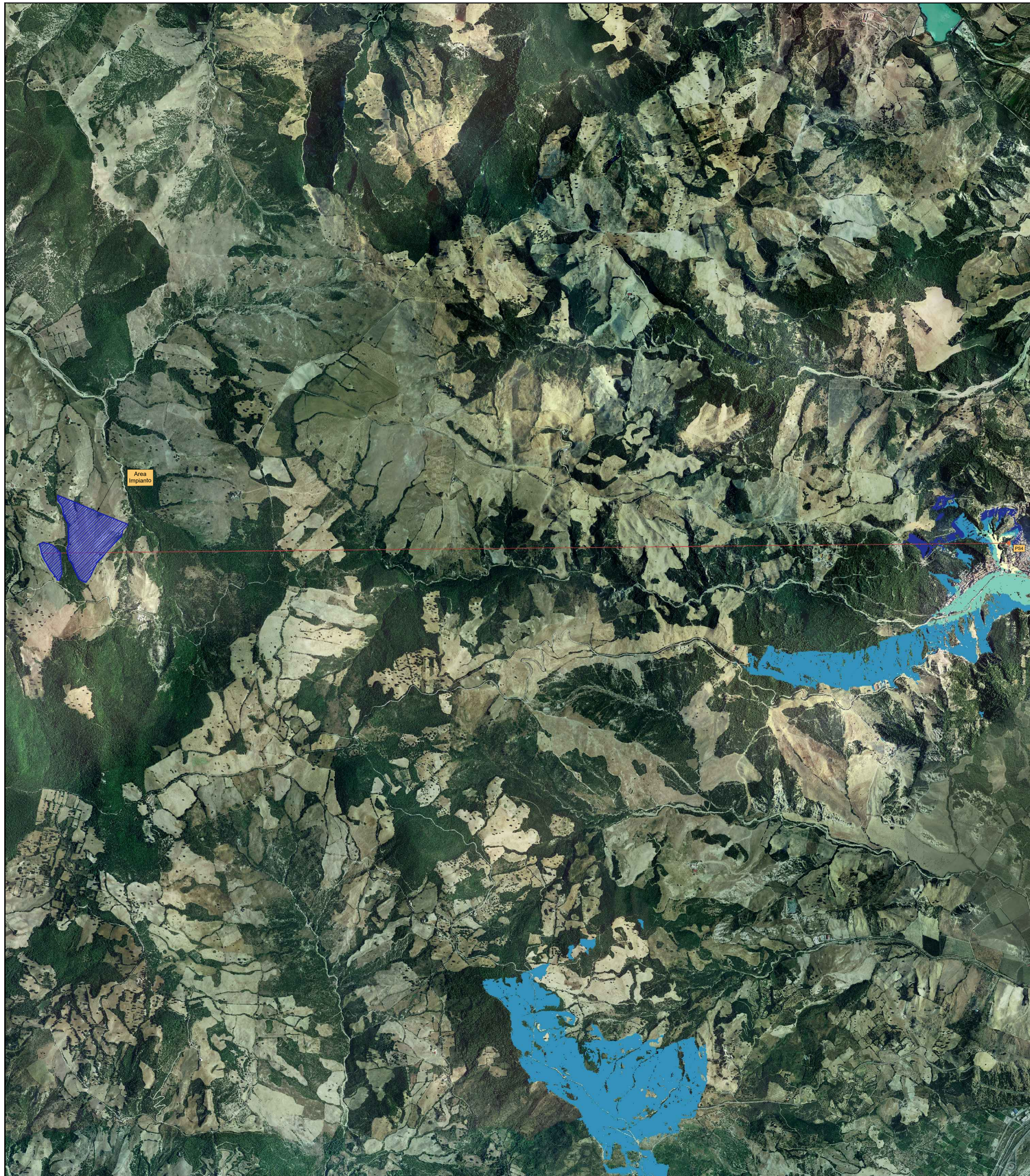
Profilo Punto Sensibile PS4 - Tursi Zona A