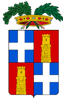
Provincia di Sassari