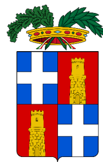
Comune di Sassari