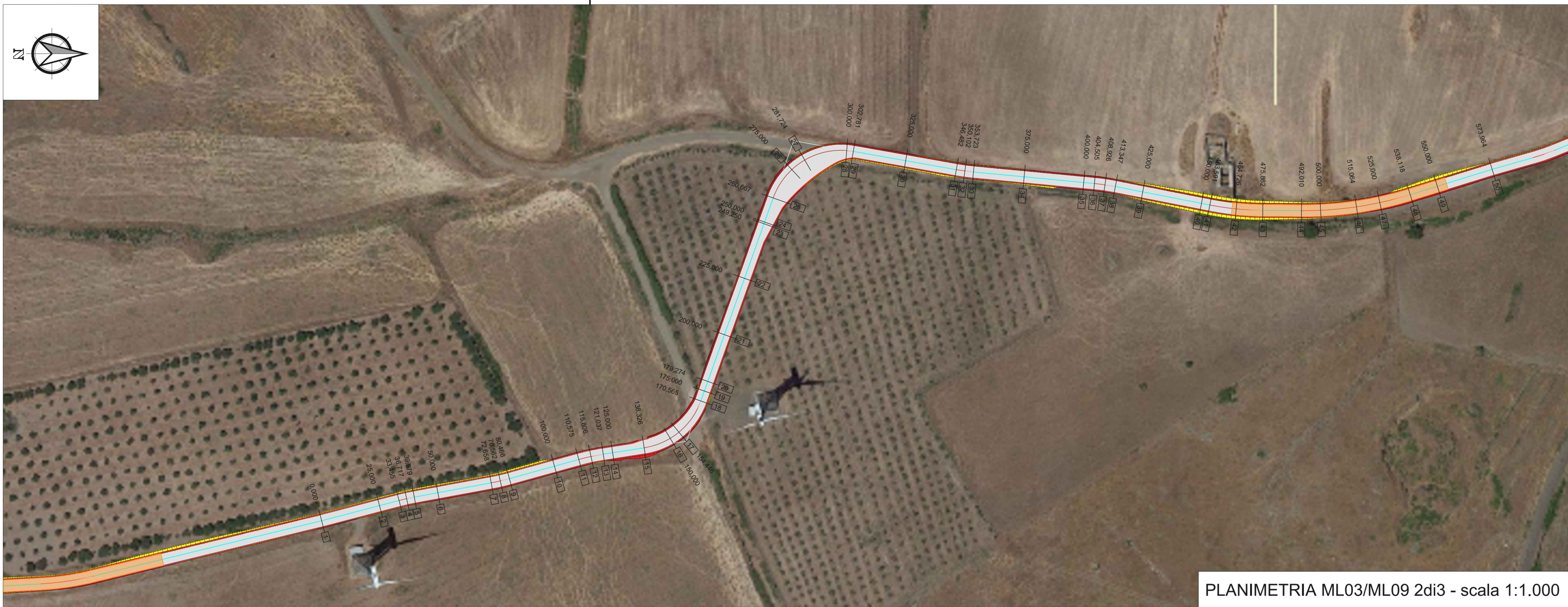
PLANIMETRIA ML03/ML09 2di3 - scala 1:1.000