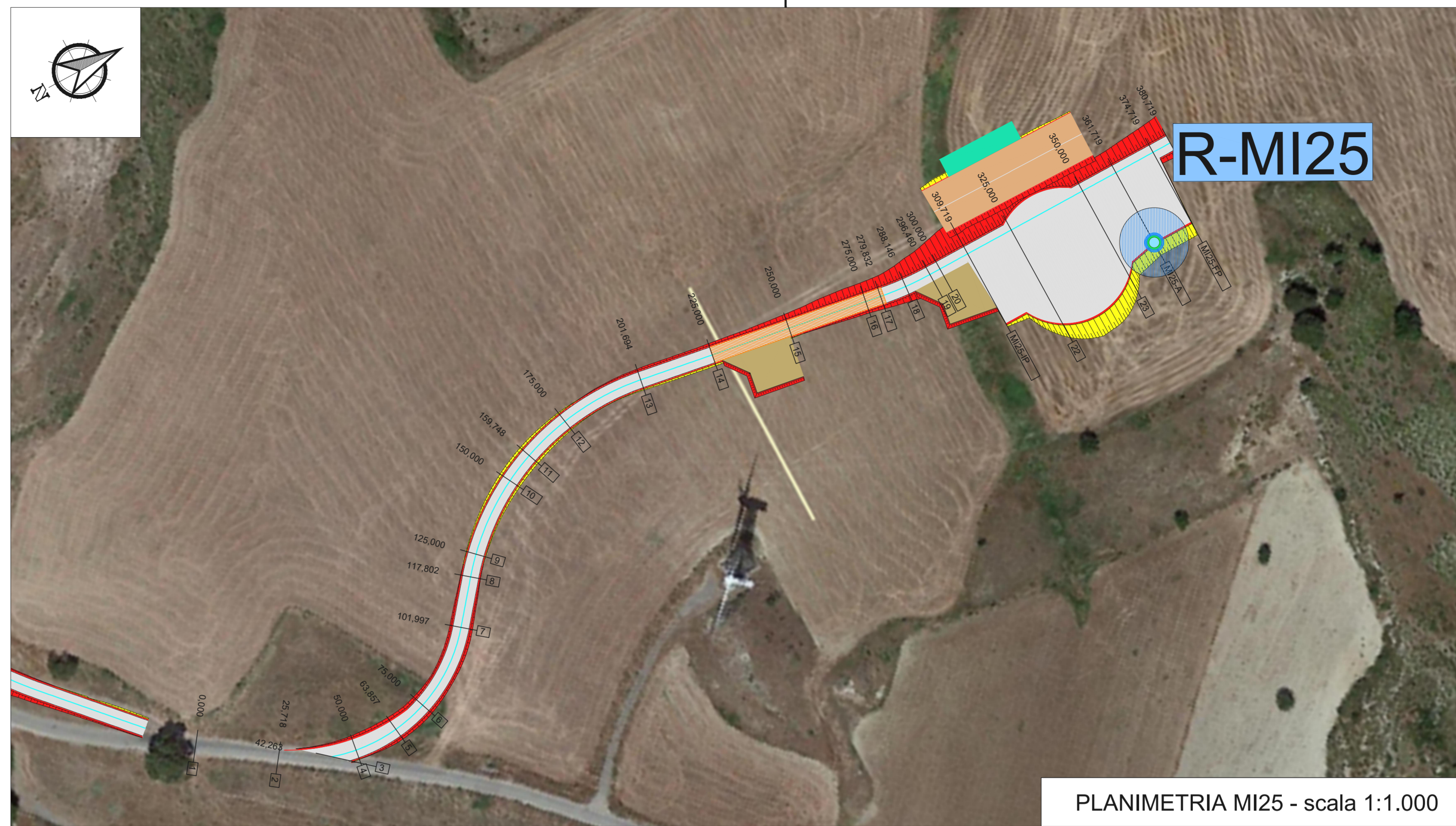
PLANIMETRIA MI25 - scala 1:1.000