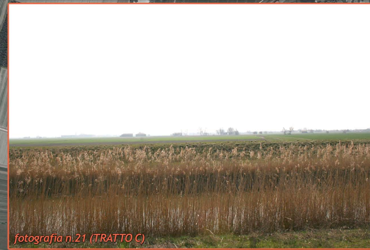
fotografia n.21 (TRATTO C)