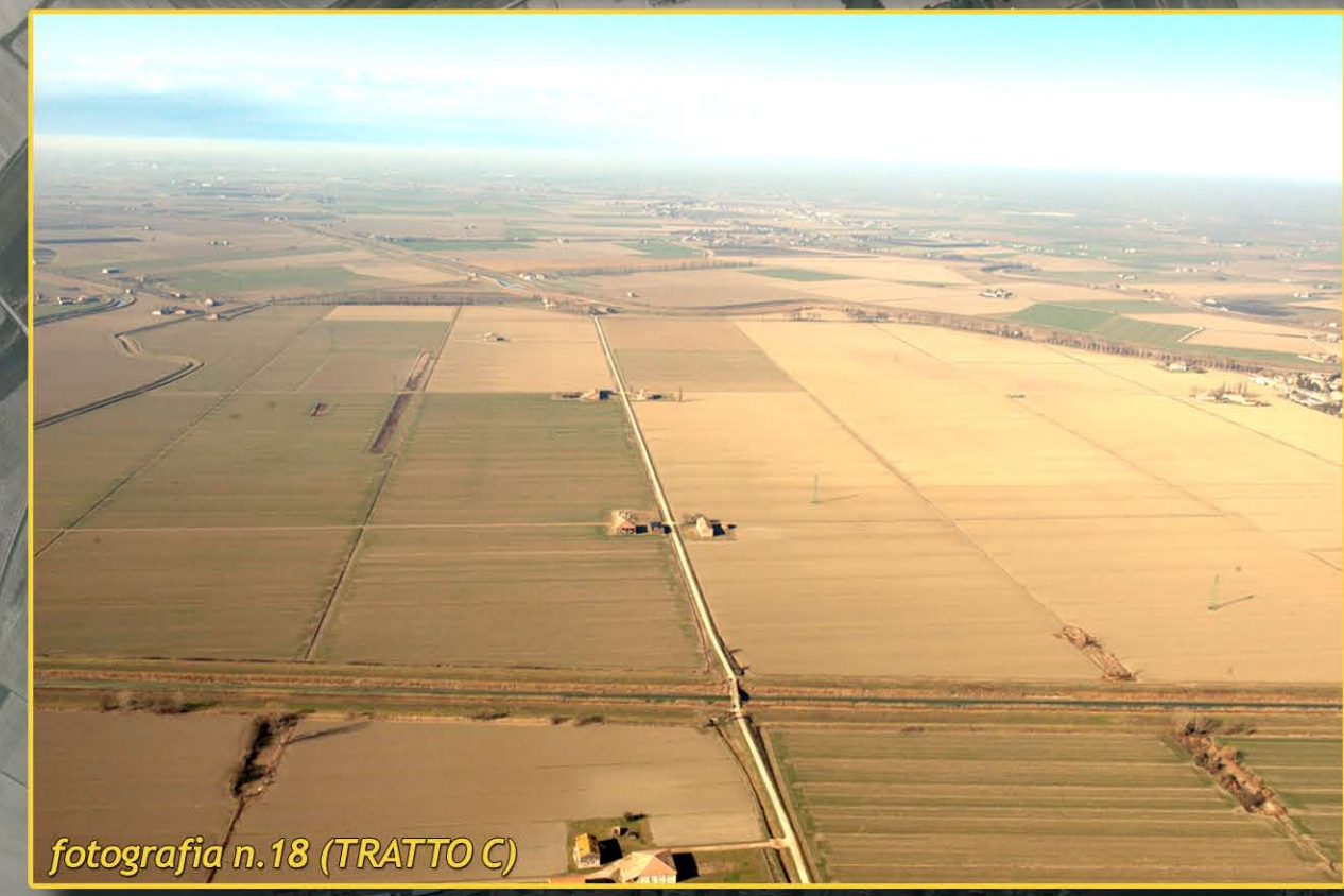
fotografia n.18 (TRATTO C)