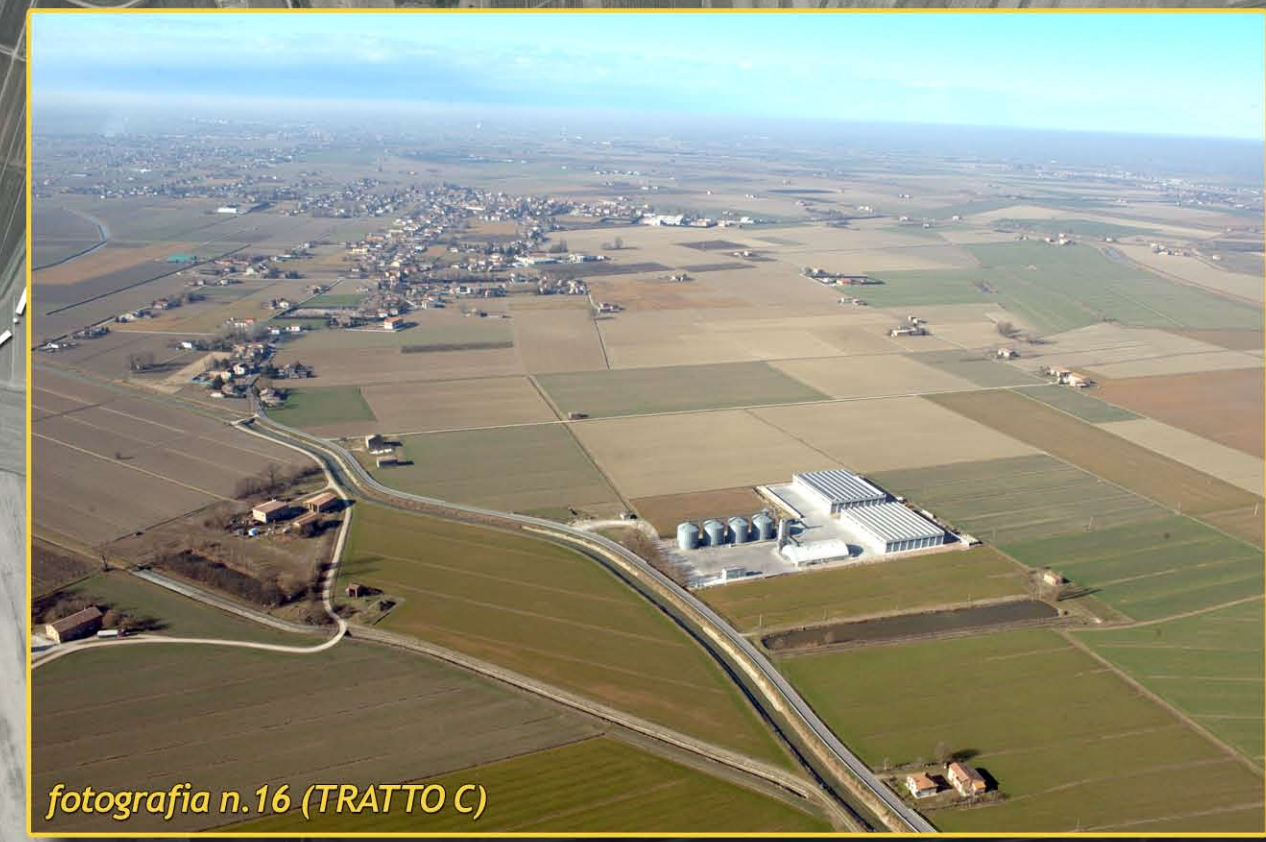
fotografia n.16 (TRATTO C)