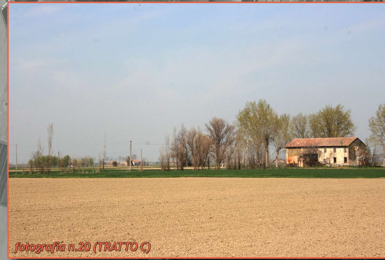
fotografia n.20 (TRATTO C)