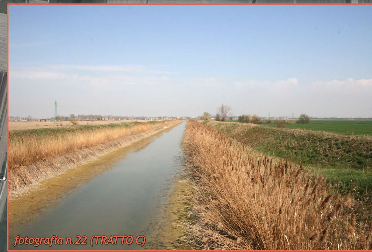
fotografia n.22 (TRATTO C)