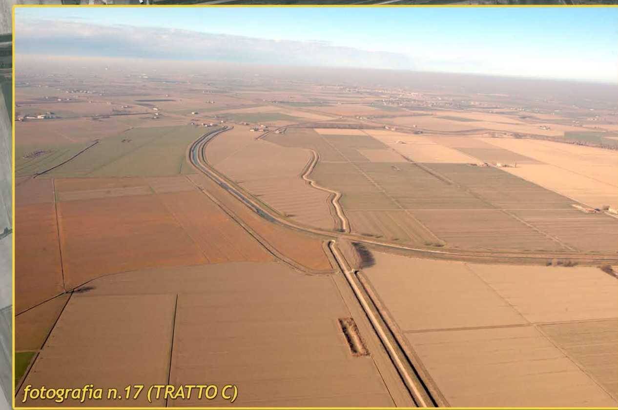
fotografia n.17 (TRATTO C)