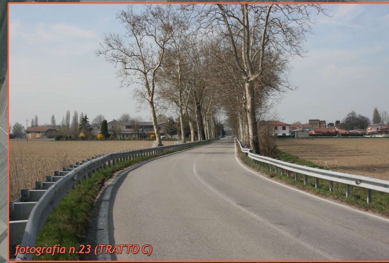
fotografia n.23 (TRATTO C)