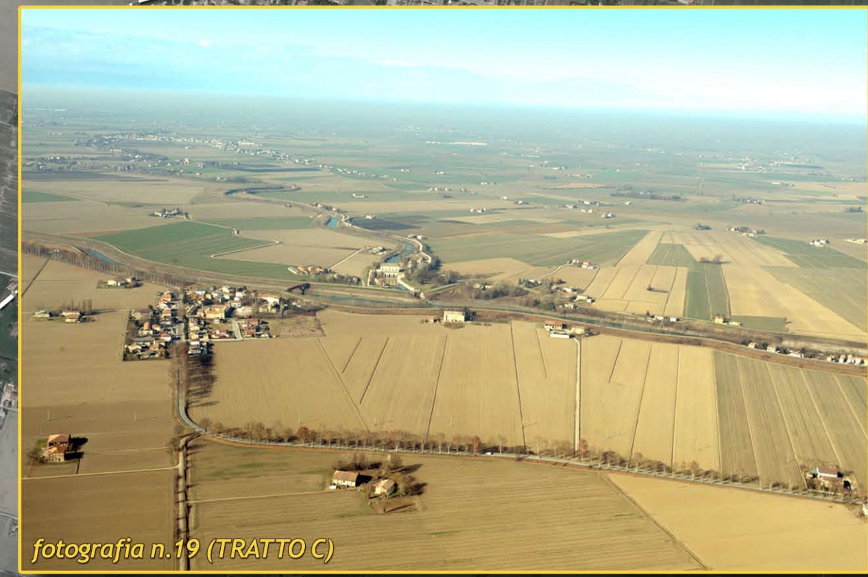
fotografia n.19 (TRATTO C)