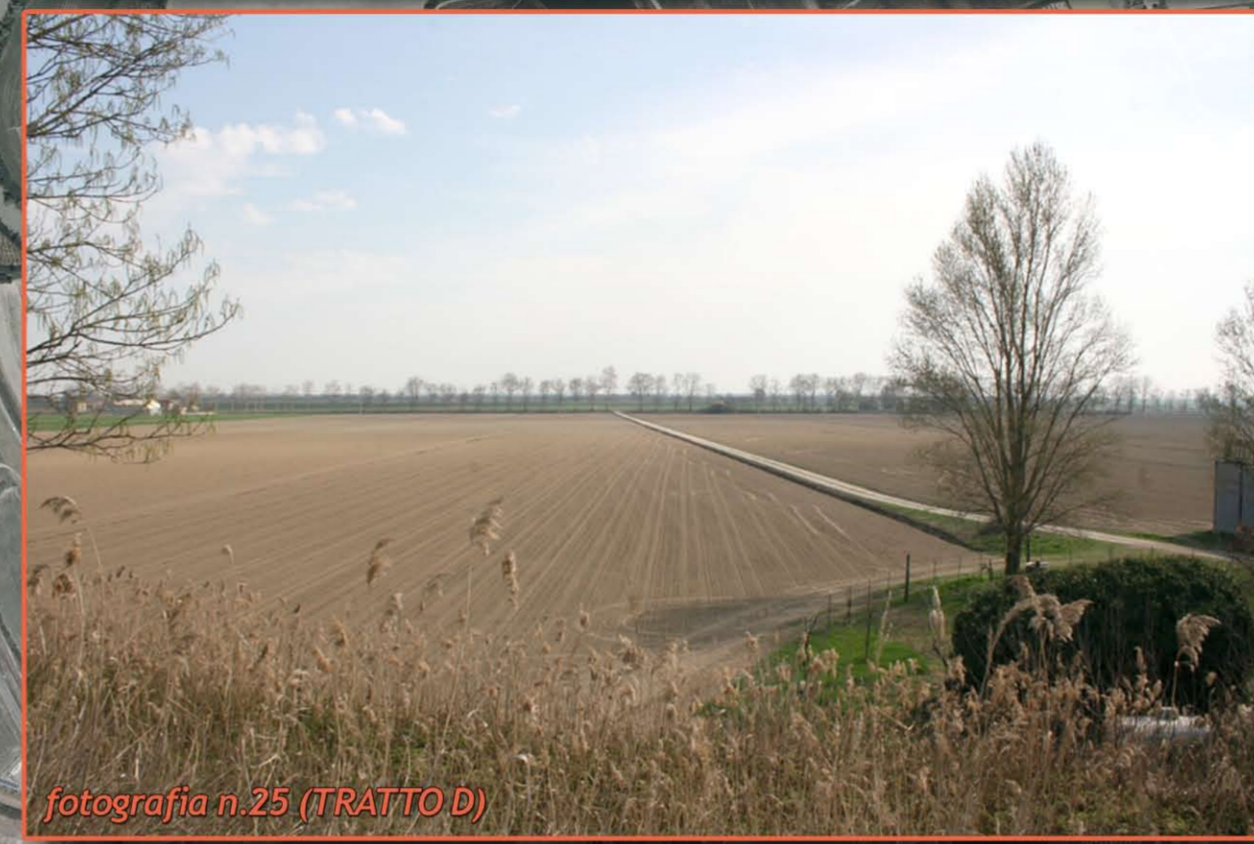
fotografia n. 25 (TRATTO D)