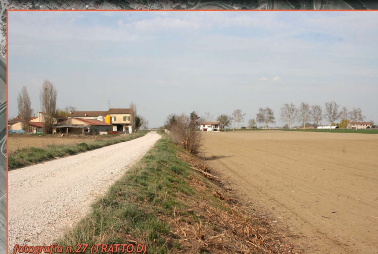
fotografia n. 27 (TRATTO D)