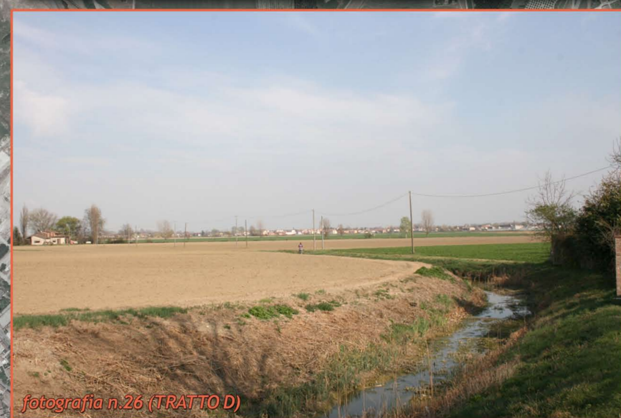
fotografia n. 26 (TRATTO D)