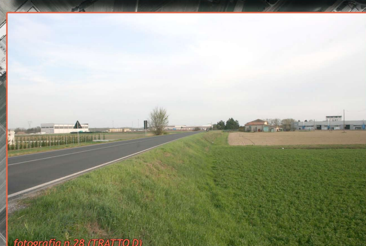
fotografia n. 28 (TRATTO D)