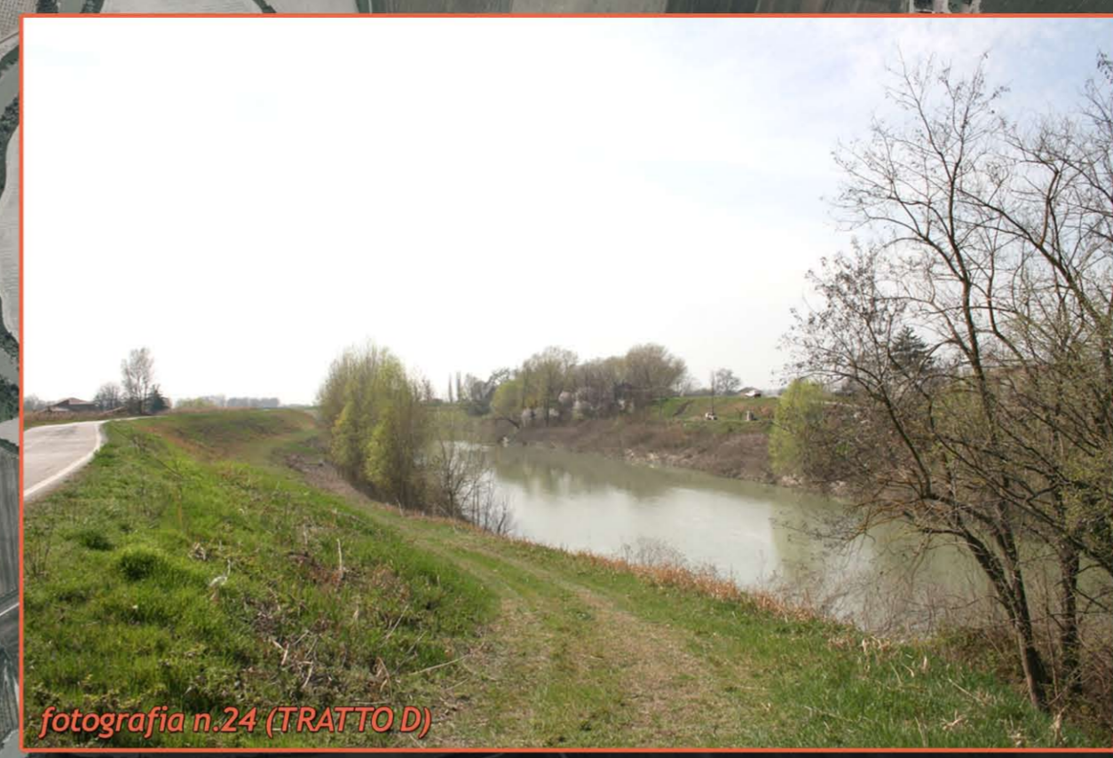
fotografia n. 24 (TRATTO D)