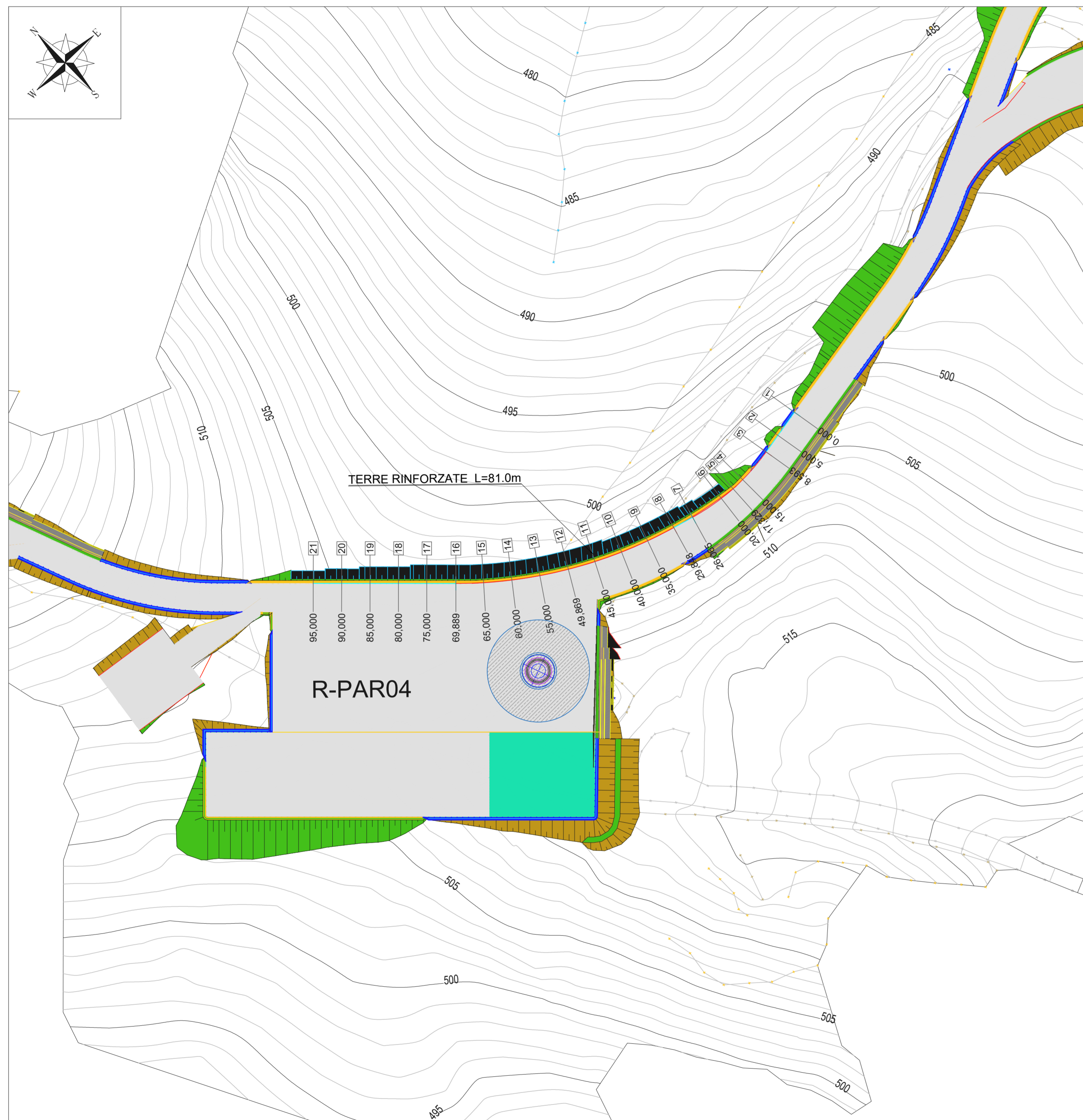
PIAZZOLA R-PAR04: PLANIMETRIA DELLE TERRE RINFORZATE SCALA 1:500