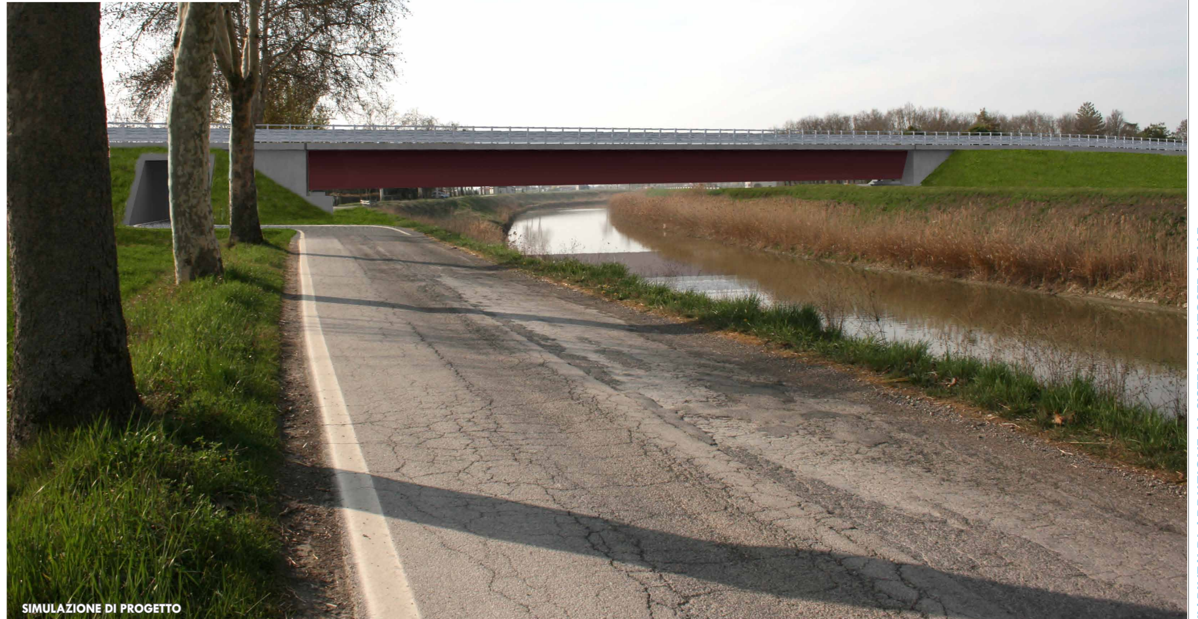
SIMULAZIONE DI PROGETTO