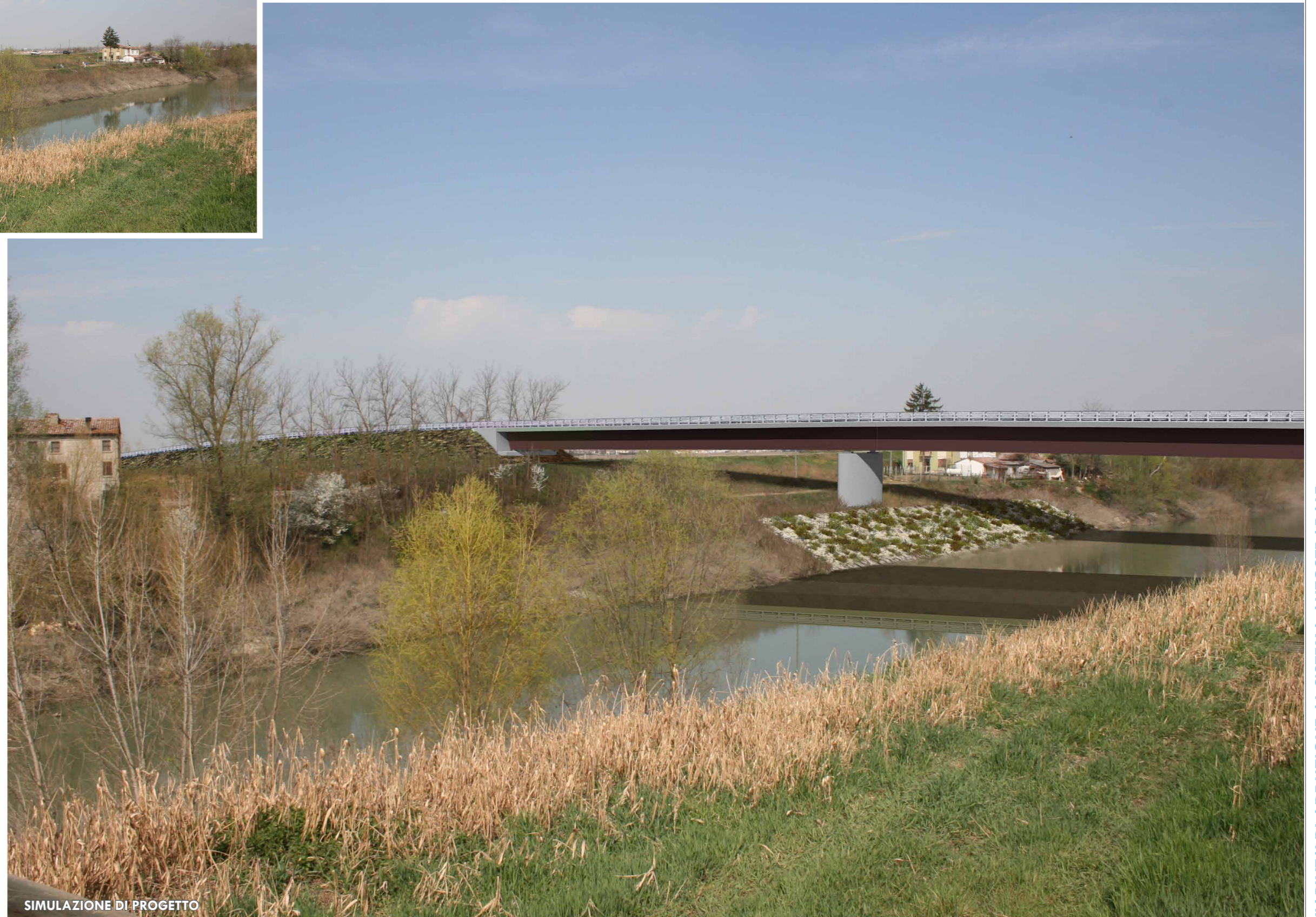
SIMULAZIONE DI PROGETTO