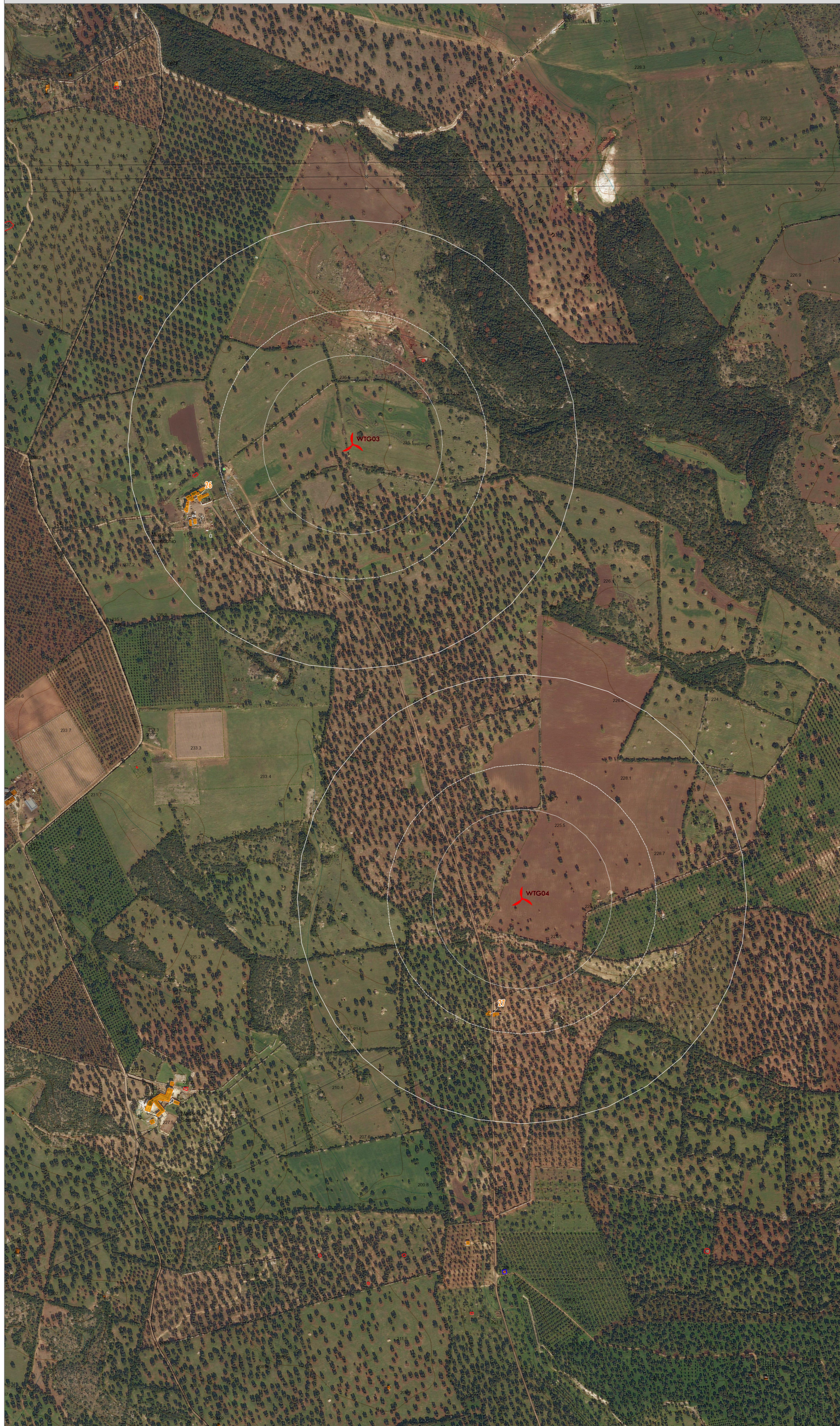
MAP 1: ORTOFOTO CON SOVRAPPOSIZIONE DELLA CTR