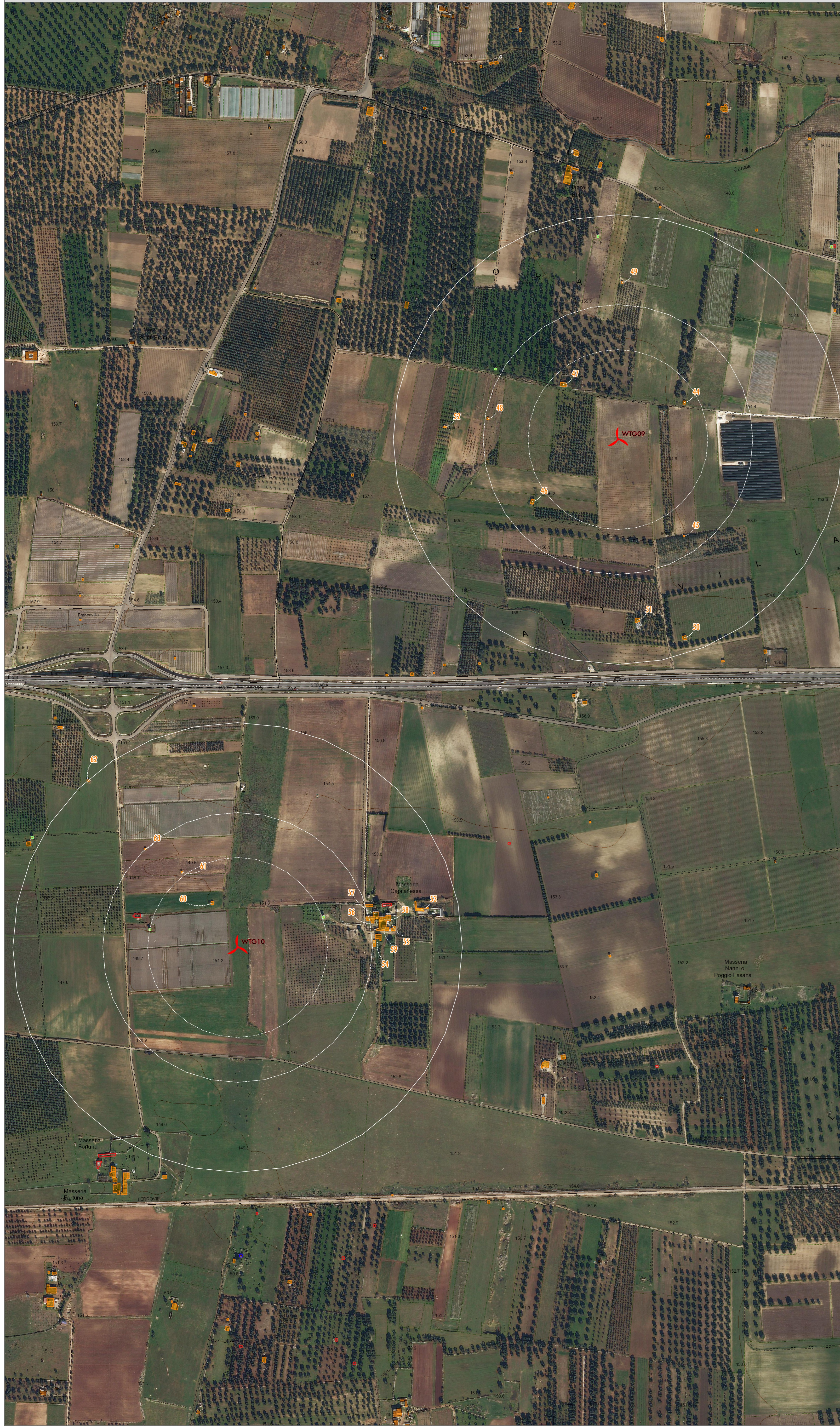
MAP 1: ORTOFOTO CON SOVRAPPOSIZIONE DELLA CTR