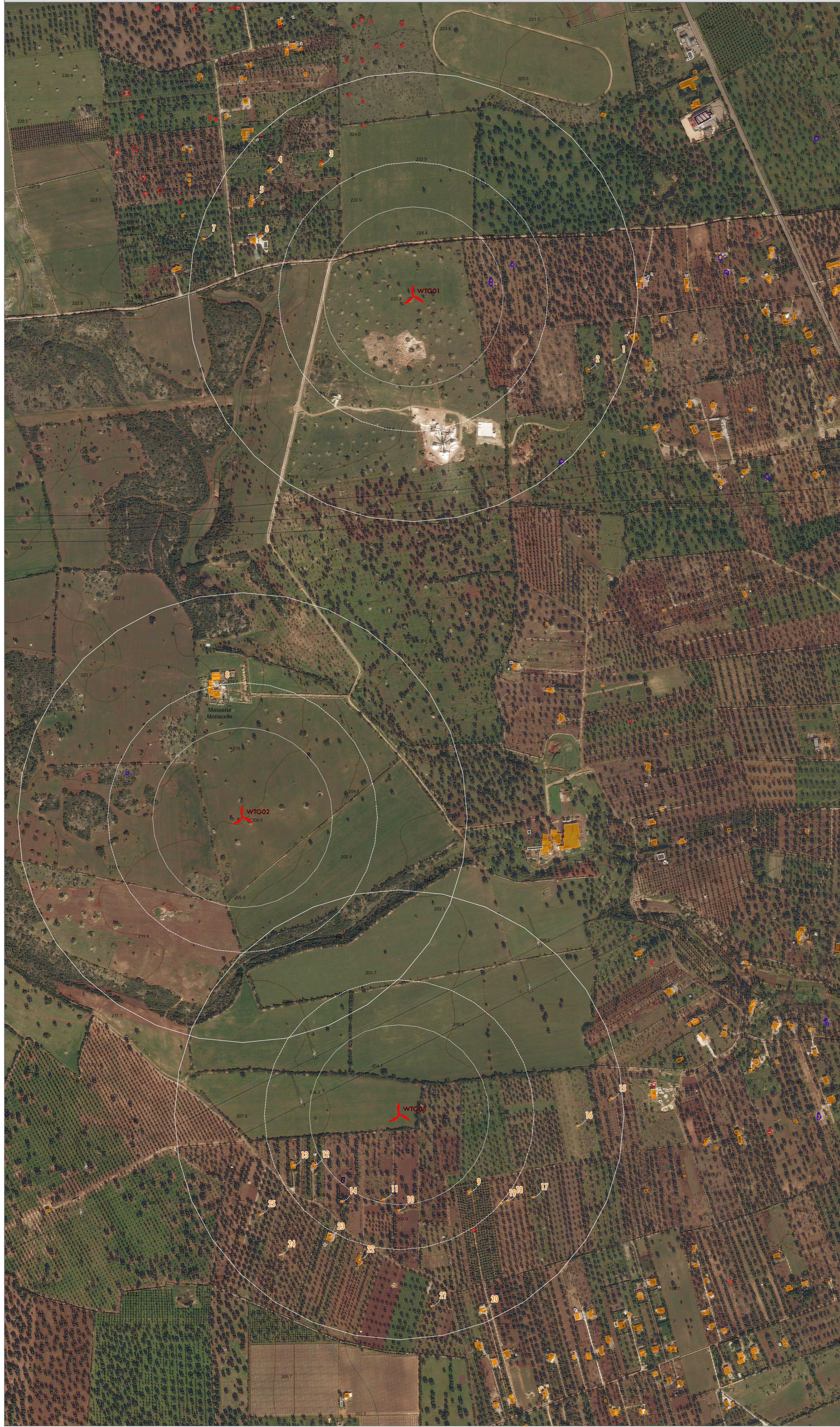
MAP 1: ORTOFOTO CON SOVRAPPOSIZIONE DELLA CTR