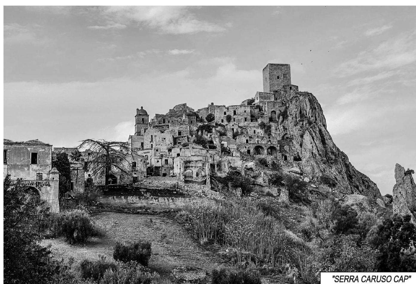
"SERRA CARUSO CAP"