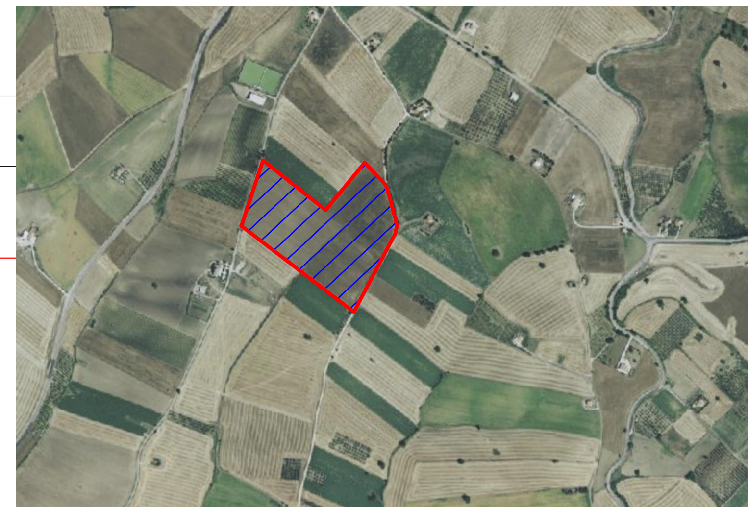
SOTTO CAMPO 6 SCALA 1:5.000