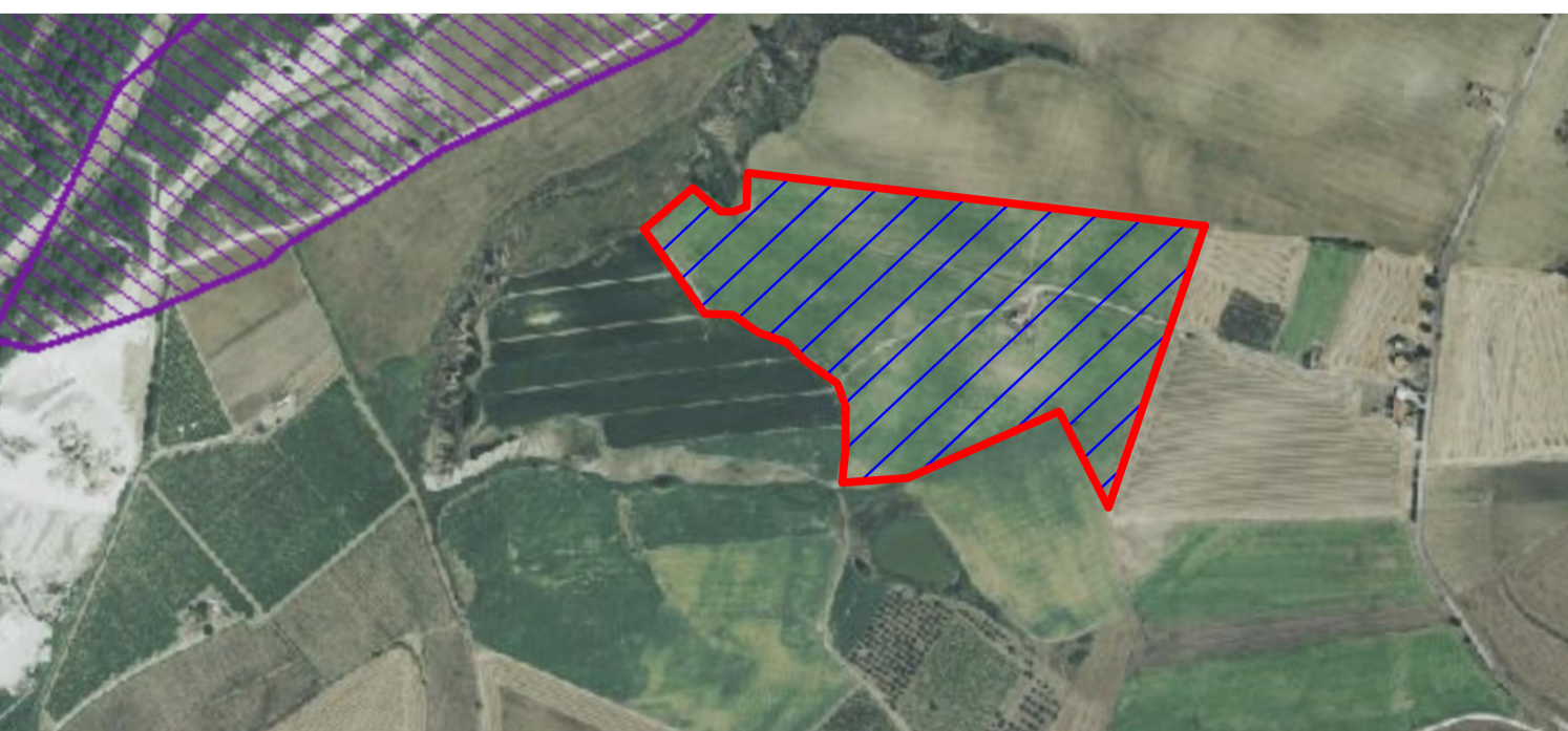
SOTTO CAMPO 1 SCALA 1:5.000