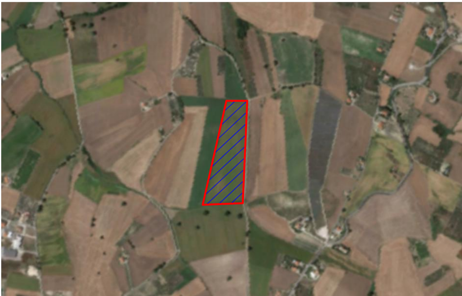
SOTTO CAMPO 8 SCALA 1:5.000