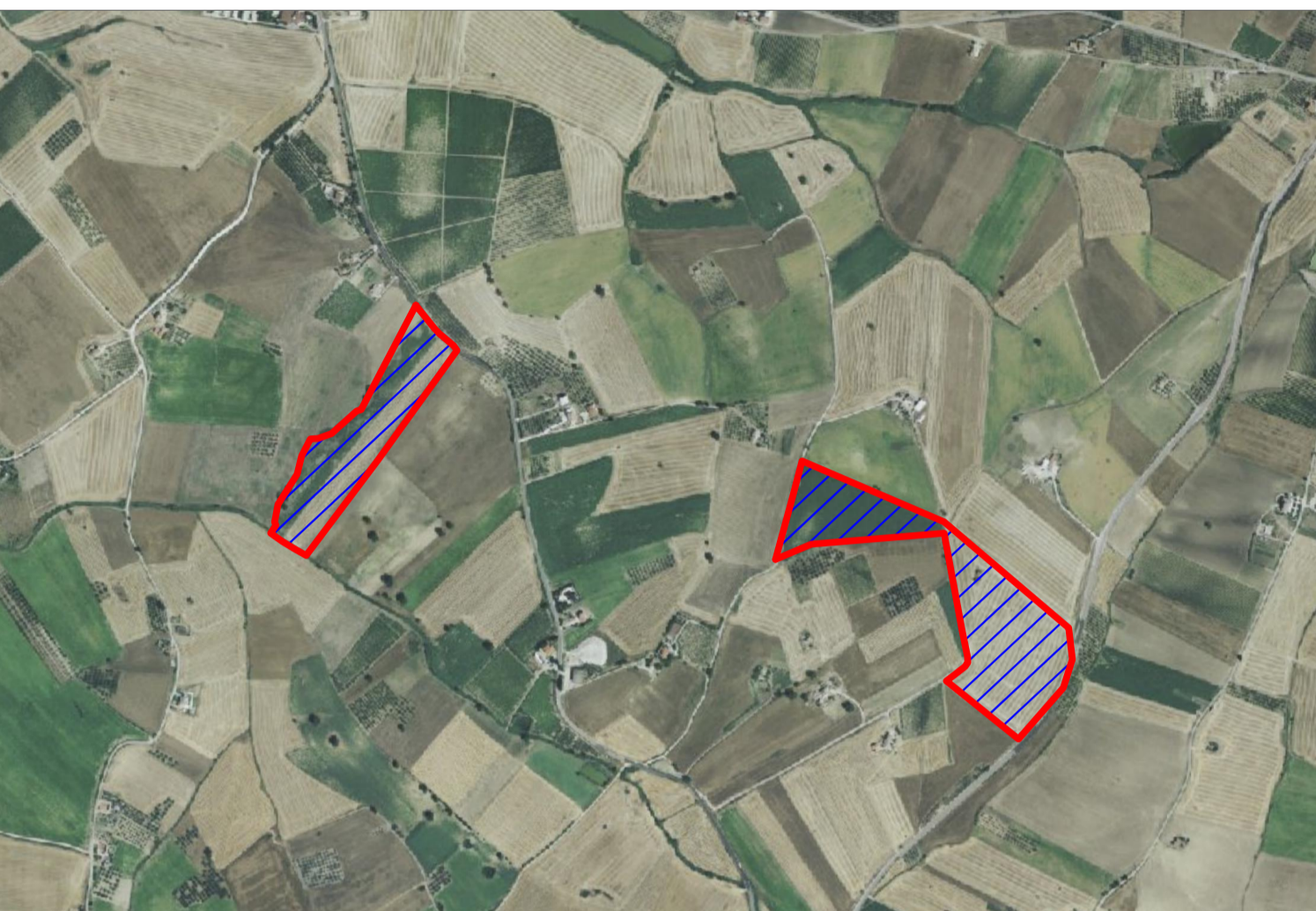
SOTTO CAMPO 5-9 SCALA 1:8.000