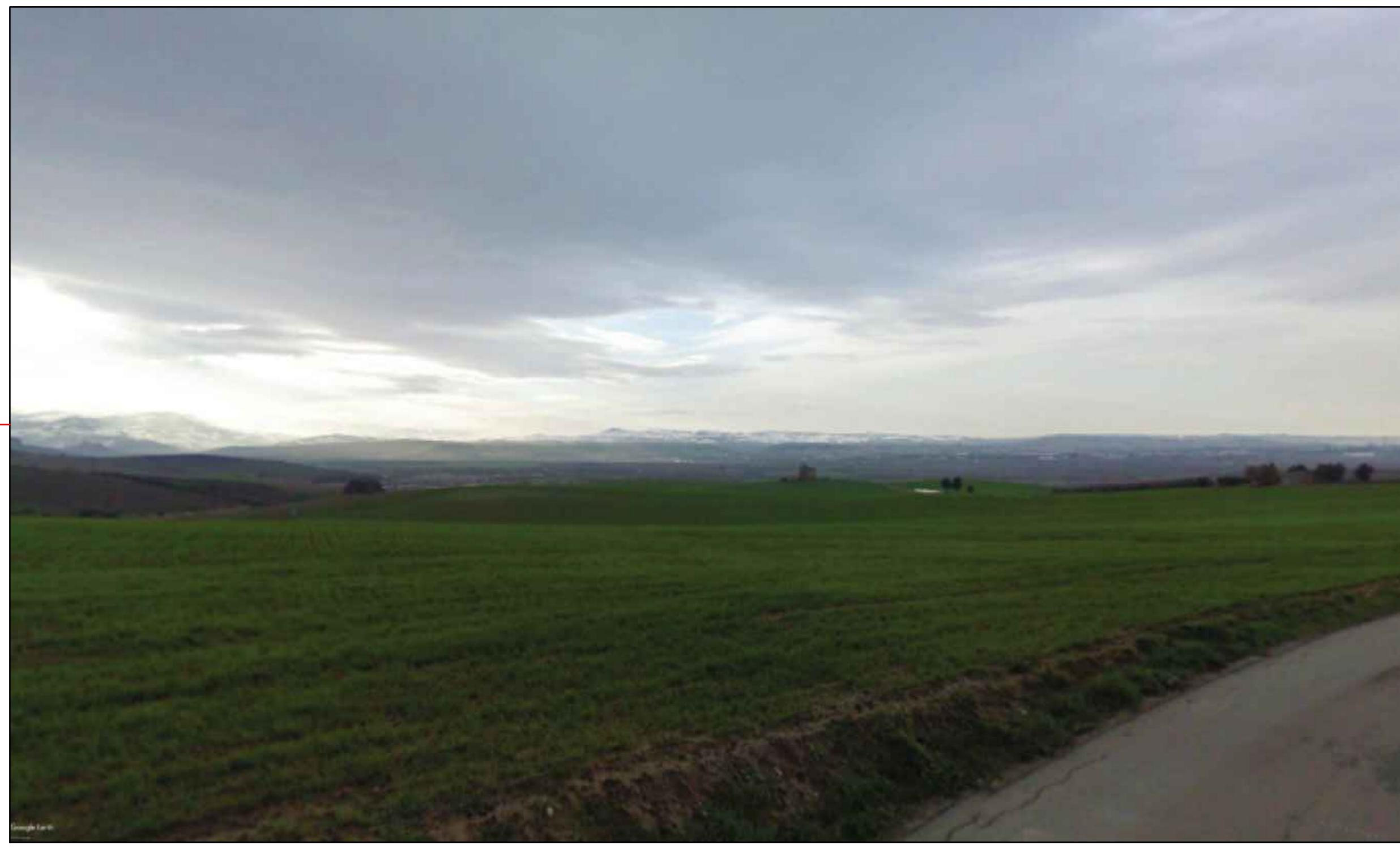
① (42°00'01.68"N - 14°59'46.07"E) VISTA DELL'IMPIANTO ANTE-OPERAM