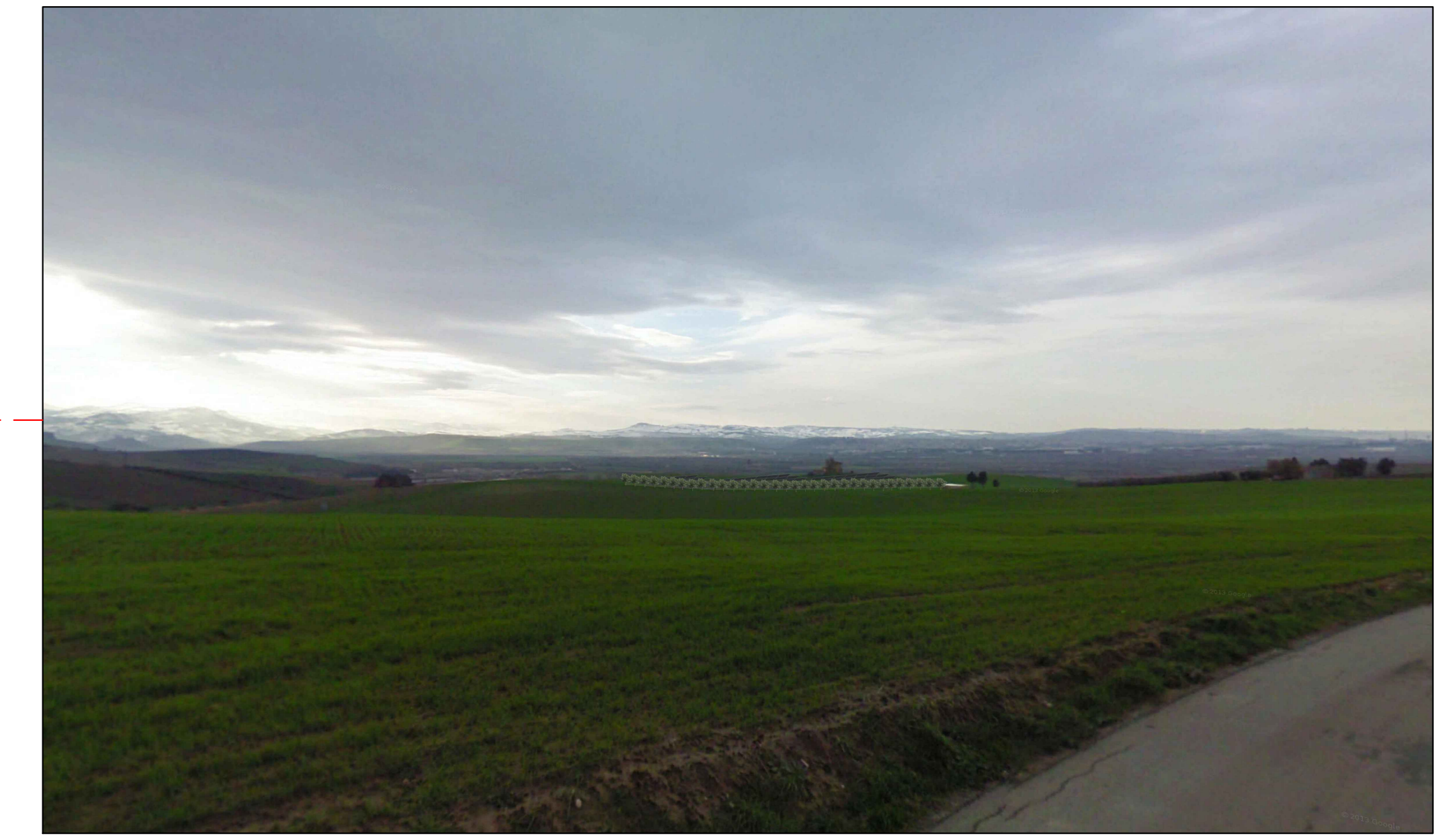
① (42°00'01.68"N - 14°59'46.07"E) VISTA DELL'IMPIANTO CON MITIGAZIONE