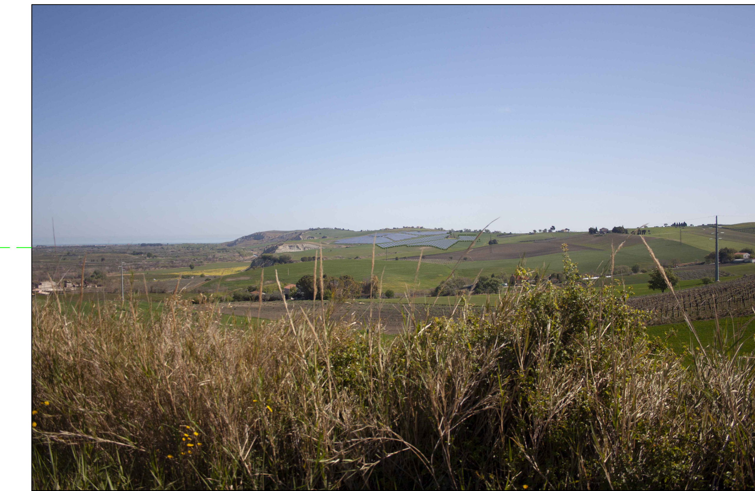
① STRADA PROVINCIALE SP55 VISTA DELL'IMPIANTO CON MITIGAZIONE