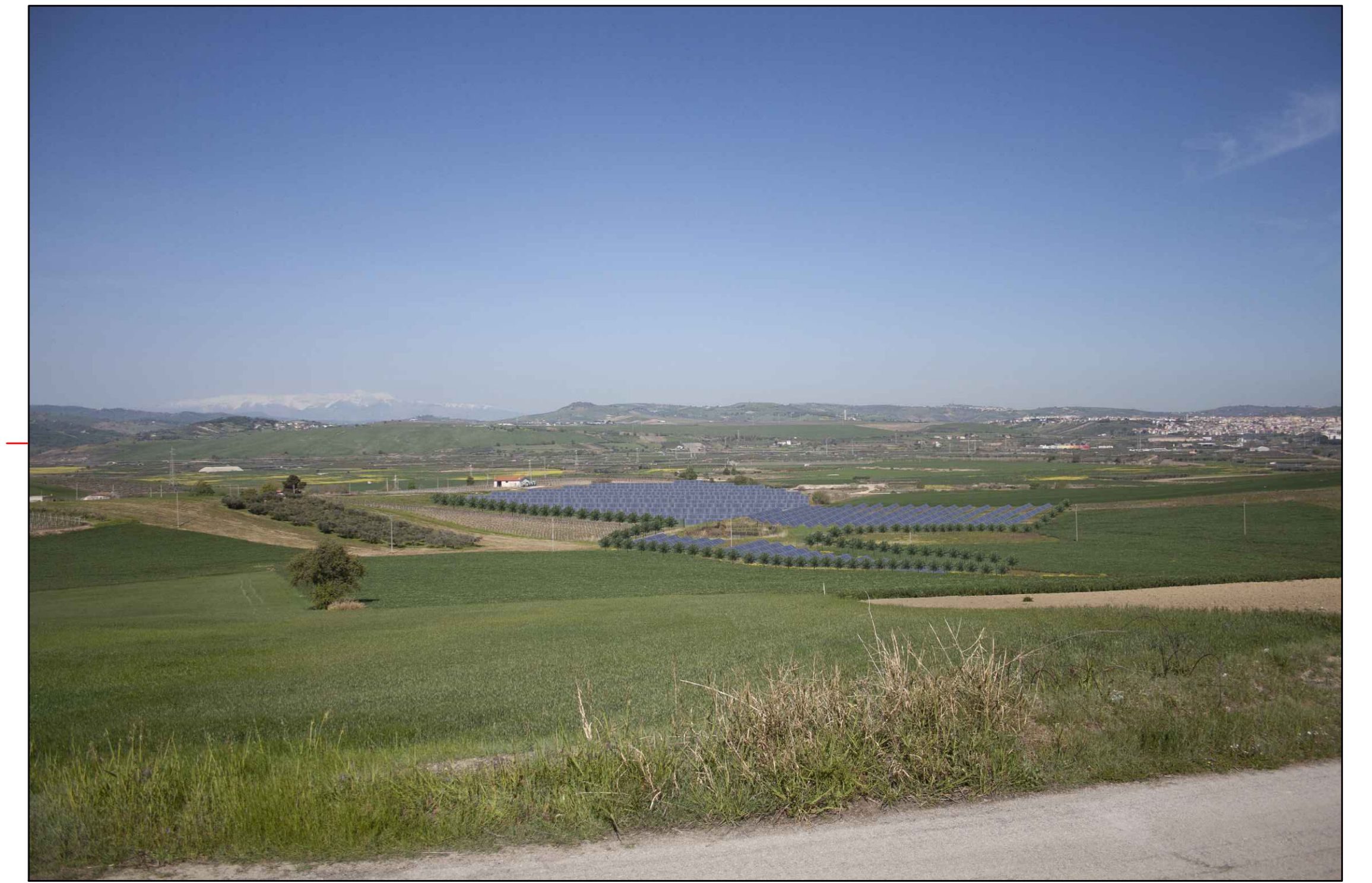
② (42°00'33.23"N - 14°45'47.75"E) VISTA DELL'IMPIANTO CON MITIGAZIONE