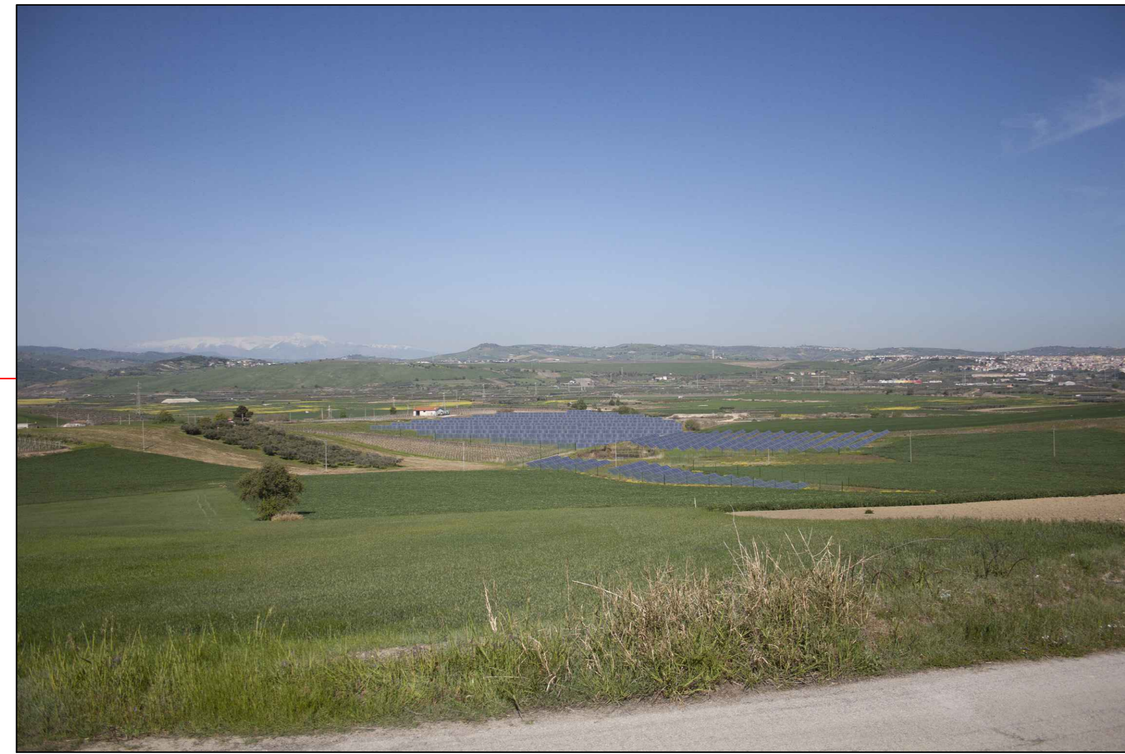
② (42°00'33.23"N - 14°45'47.75"E) VISTA DELL'IMPIANTO SENZA MITIGAZIONE