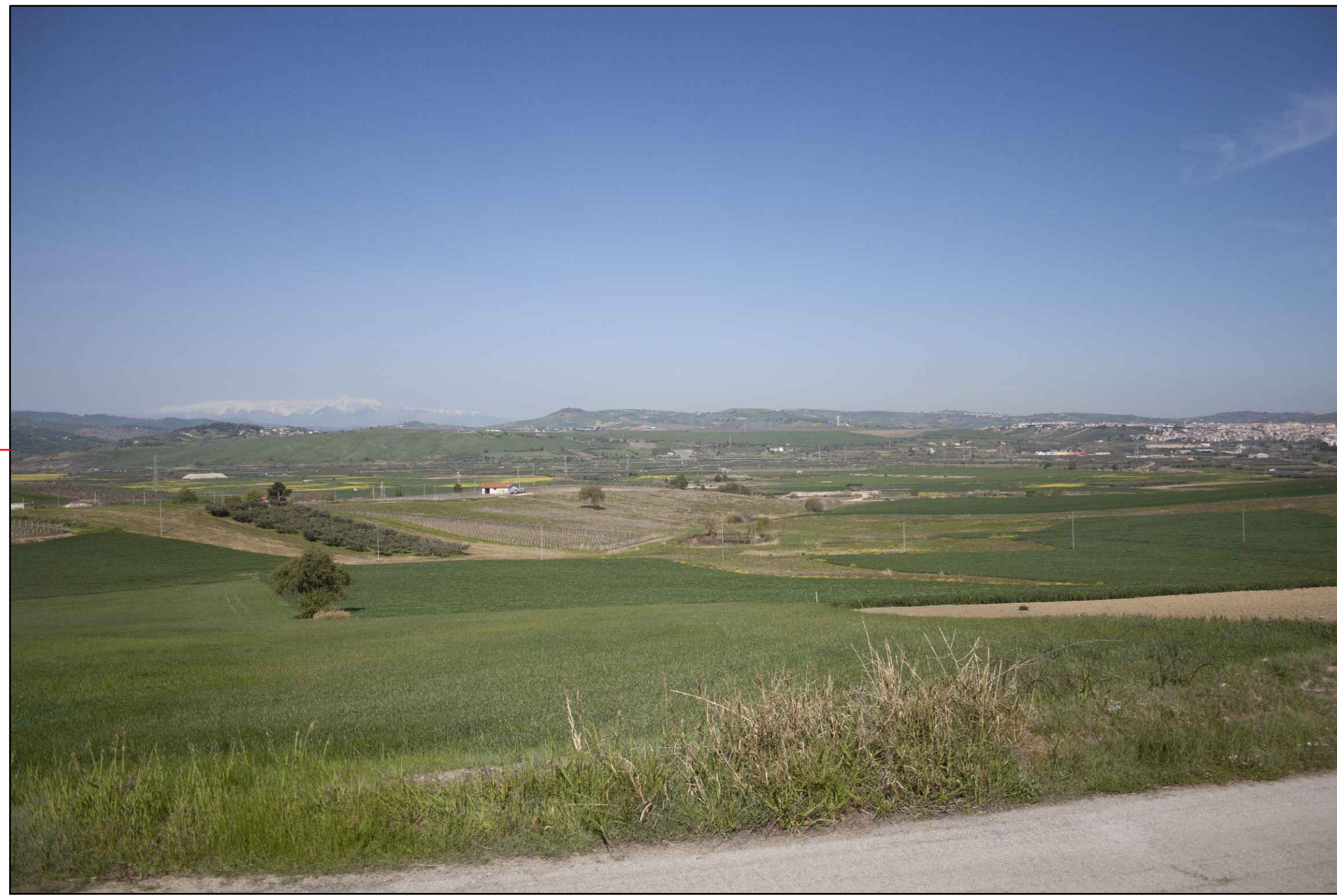
② (42°00'33.23"N - 14°45'47.75"E) VISTA DELL'IMPIANTO ANTE-OPERAM